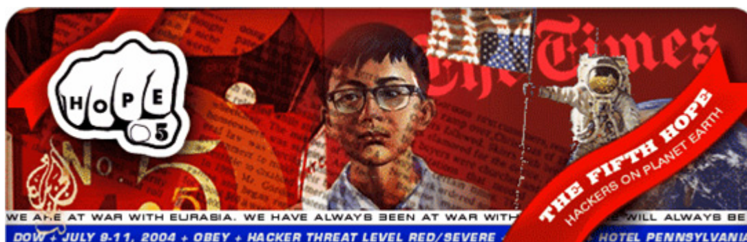
Figura 4 - HOPE - Hackers on Planet Earth

década de 60 do século passado e questionarmos como teria sido o Maio de 68 em França se a Internet estivesse acessível nessa altura!