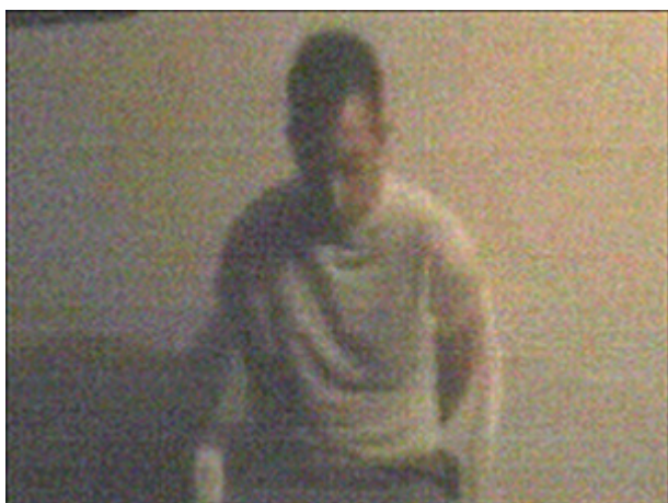
Figura 9 - Imagem do vídeo forjado

Em qualquer dos dois casos um dos pontos que salta à vista é o facto da impossibilidade de verificar a veracidade das afirmações, nem sequer é possível confirmar que os dois autores se encontram realmente onde dizem que estão, e este é sem dúvida um dos grandes problemas que este tipo de suporte levanta. Como ficou demonstrado pelo americano Benjamin Vanderford 14 , um criador de jogos de computador de 22 anos de idade e membro do grupo de musical experimental “fluorescent grey”. Em Maio de 2003, Benjamin forjou um vídeo com imagens da sua fictícia execução 15 por parte de um grupo terrorista.