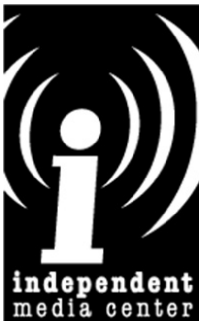
Figura 2 - Símbolo do IMC

Nas suas próprias palavras o IMC define-se como sendo “uma rede de média não alinhados destinado à criação de escritos verdadeiros, radicais, precisos e apaixonados. Resultado do trabalho, amor e inspiração de pessoas que continuam a trabalhar para um mundo melhor, apesar da tentativa corporativa dos média de distorcer e encobrir o esforço de libertação da humanidade” 2 .