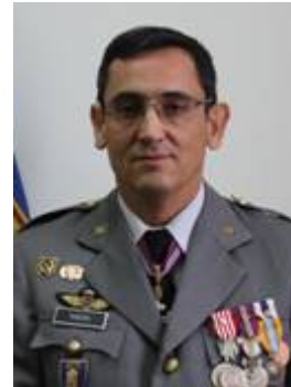
Coronel Carlos Jorge de Oliveira Ribeiro