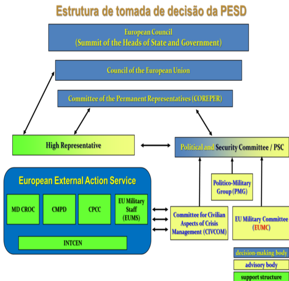
Figura 1 - Estrutura de decisão da PESD

O COPS/PSC possui três estruturas de aconselhamento: CMUE/EUMC [111] , o Comité para os Aspectos Cívicos da Gestão de Crises (CIVCOM [112] ) e o Grupo Político-Militar (PMG [113] ).