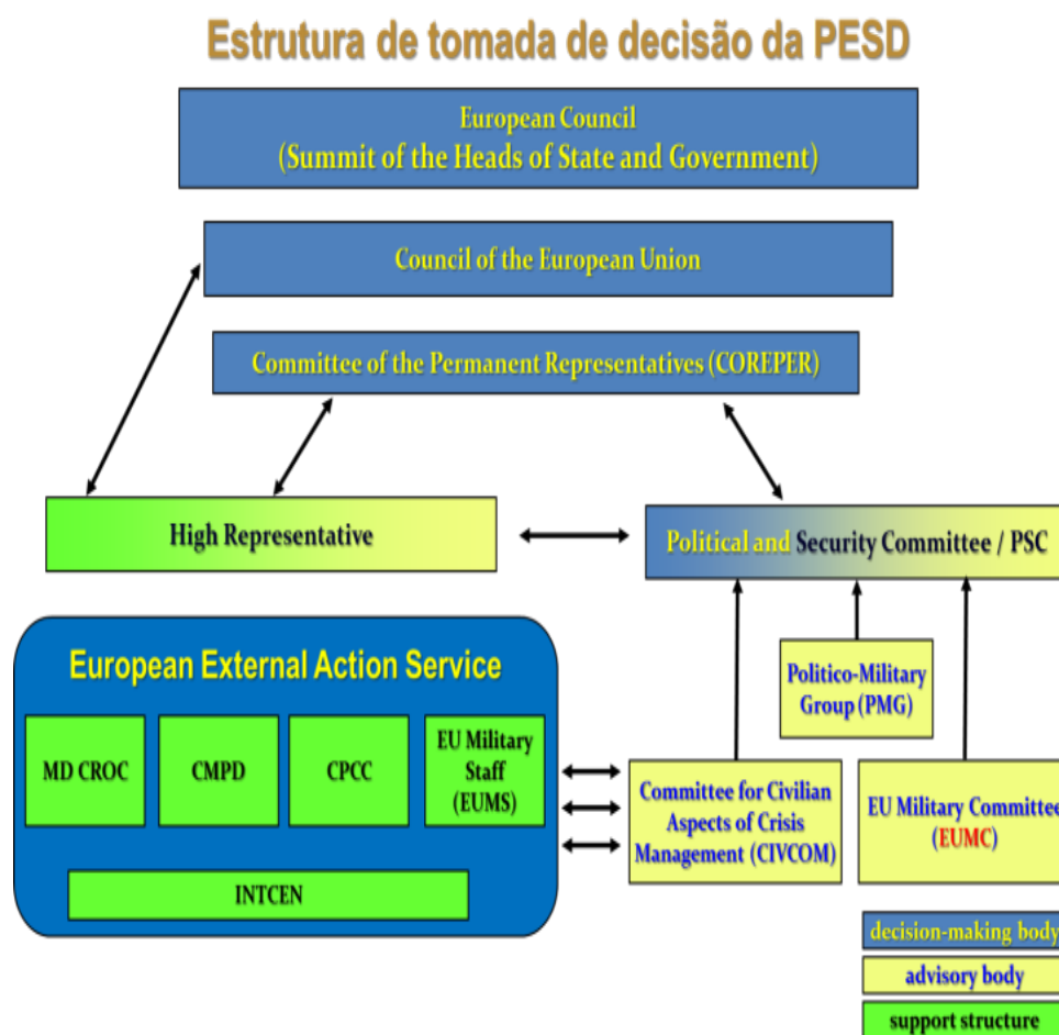
Figura 1 - Estrutura de decisão da PESD

O COPS/PSC possui três estruturas de aconselhamento: CMUE/EUMC [111] , o Comité para os Aspectos Cívicos da Gestão de Crises (CIVCOM [112] ) e o Grupo Político-Militar (PMG [113] ).