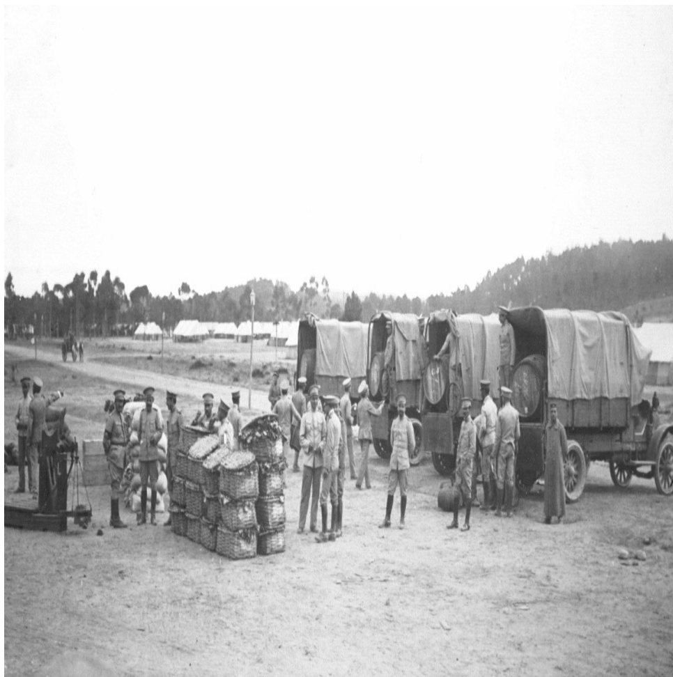
Figura 3 - Abastecimentos durante os exercícios em Tancos (1916).

Uma Nota de 15 de Abril, da Divisão de Instrução para a Secretaria da Guerra, tratava da construção de um barracão para ser matadouro junto a Barquinha, pois os matadouros municipais da Golegã e Barquinha não tinham capacidade para abater mais do que vinte rezes bovinas, quantidade insignificante para a Divisão de Instrução.