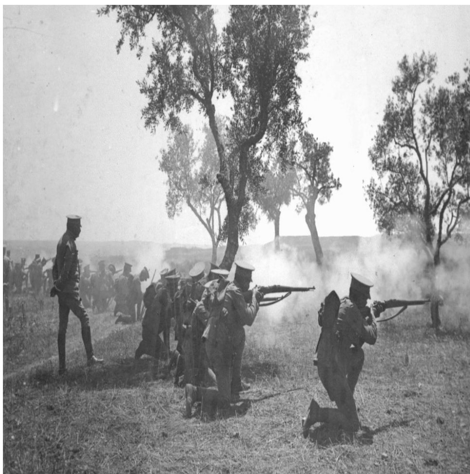
Figura 1 - Treino da infantaria em Tancos (1916) ainda sem dispor do capacete, novidade desta guerra e que seria usado no TO.

era muito elevada e foi reduzindo pela ação de controlo mais apertado, com a colaboração da GNR e de algumas medidas legislativas envolvendo as juntas de freguesias. No ano de 1915, por exemplo, a percentagem de refractários foi cerca de 33%, correspondendo a 22.862 homens que não se apresentaram à inspeção, num universo de 70.000 homens recenseados para inspeção.