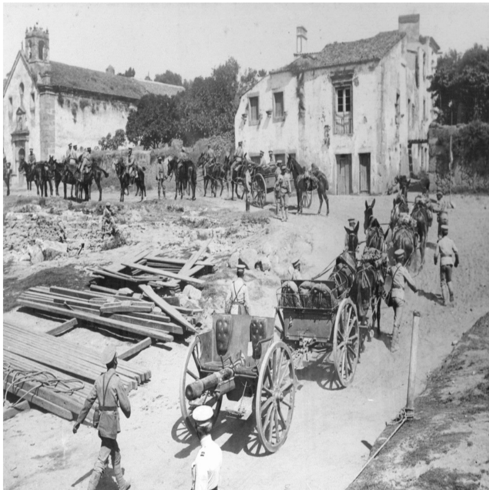
Figura 4 - Uma bateria de peças de artilharia 7,5 cm M/1904 (francesa) nos exercícios ainda sem capacete. No TO em França não foi esta peça que foi usada mas sim outro modelo francês 7,5 cm/1917.

elaborassem um regulamento para a regulação tiro de artilharia por meio de aeroplanos e que este fosse usado nos exercício finais da 3ª Brigada, nos dias 15 e 16 de Novembro.