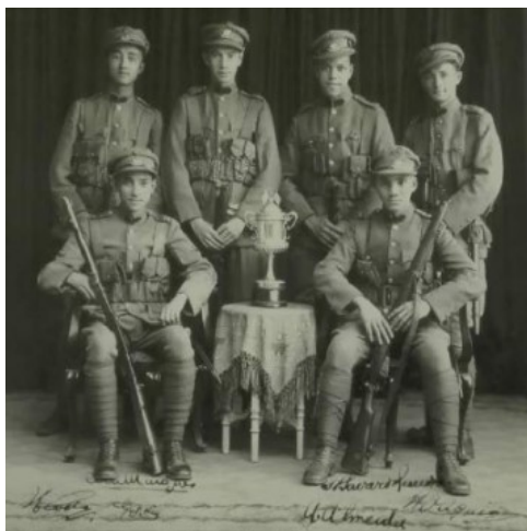
Figura 7 – Campeões do concurso anual de tiro, ano de 1930.