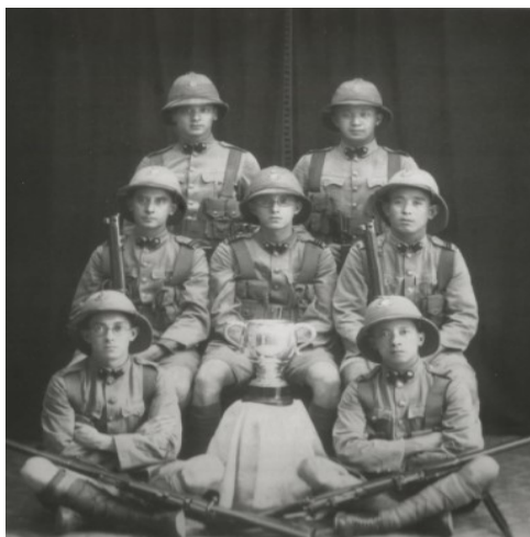
Figura 6 - Companhia Portuguesa vencedora da "British Cup" (1926).