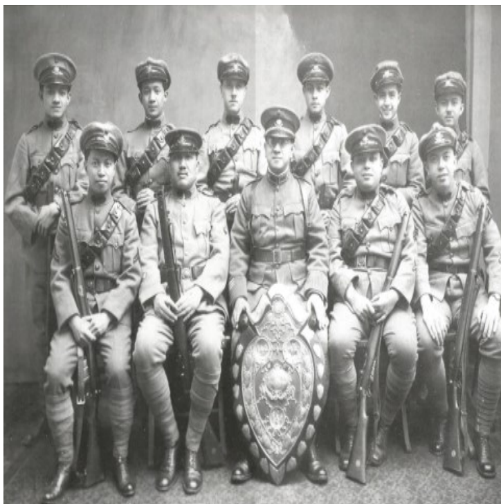
Figura 5 - Vencedores da competição anual "SVC Inter-Company Challenge Shield" (1919).