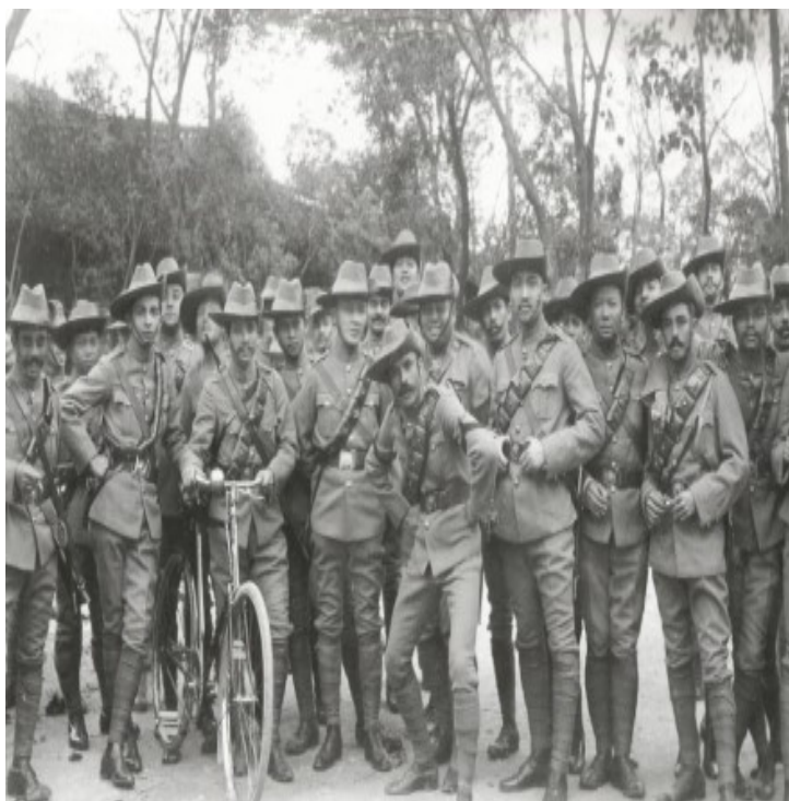
Figura 3 - Fotografia tirada imediatamente após a conclusão de exercícios de treino, conjuntamente com a Companhia Alemã (4 de Novembro de 1906).