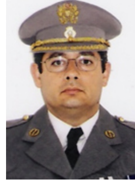
Tenente-coronel Rui Pires de Carvalho

Como referido na introdução do artigo do mesmo nome, publicado em 2014 1 , o autor admitia a possibilidade de eventuais erros e omissões.