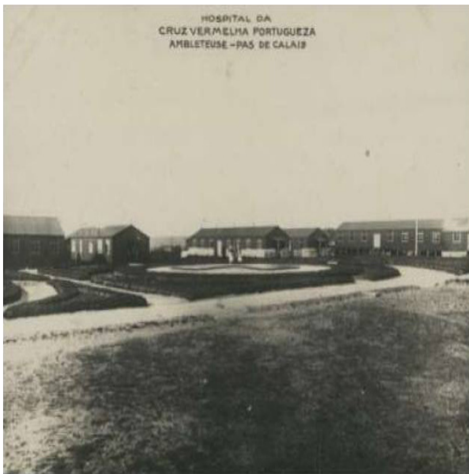
Figura 2 - Hospital da Cruz Vermelha, em Ambletense (1916).

mobilização de tropas portuguesas para a Frente Ocidental, se tinha disponibilizado para planear e criar essa Unidade, com capacidade para 300 camas 9 .