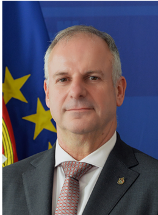
Tenente-general Nuno Correia Barrento de Lemos Pires

Para quem segue as grandes questões de Segurança e Defesa no mundo, há um documento que é, sempre, muitíssimo aguardado: A Estratégia Nacional de Segurança dos Estados Unidos da América (EUA) - National Security Strategy (NSS) . Desde que Donald Trump assumiu a presidência dos EUA, vínhamos assistindo a vários anúncios de alterações profundas na estratégia de segurança dos EUA, pelo que foi com, ainda maior, expectativa que lemos a NSS publicada no passado mês de Dezembro de 2017 (disponível para consulta em: http://nssarchive.us/wp-content/uploads/2017/12/2017.pdf - ver figura 1). Vamos fazer uma leitura, necessariamente breve, dos tópicos que pensamos serem mais relevantes para entender as mudanças, ou em alguns casos, as não mudanças, na grande Estratégia dos EUA.