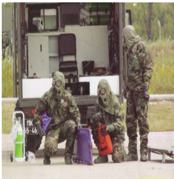
Figura 1 - O Elemento de Defesa Biológica e Química do Exército: exemplo de superespecialização.

Dentro das diversas áreas da Saúde Militar, no entanto, tal como ocorre na Sociedade Civil, é preciso ter em conta uma crescente superespecialização, não sendo aplicável, a nosso ver, o modelo de outrora em que um médico, um veterinário, um médico-dentista, um enfermeiro, etc., é deslocado por escala geral ou destacado para funções díspares, independentemente das suas competências específicas. Este aspecto trará ou deve trazer, naturalmente, repercussões nos dois seguintes pontos de análise/reflexão.