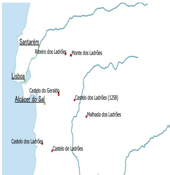
Mapa 2 - Microtopónimos relacionados com Geraldo ou com ladrões.