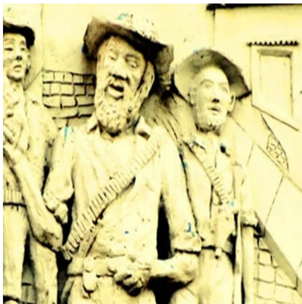
Figura 2 - Bandeirantes.

Este artigo procura realizar uma biografia de António da Silveira Peixoto (1734-1814), colocando no final uma grelha das linhas da sua carta de brasão de armas (1781) - Ávila, Bettencourt, Silveira e Peixoto, e ainda a descrição da mercê da mesma.