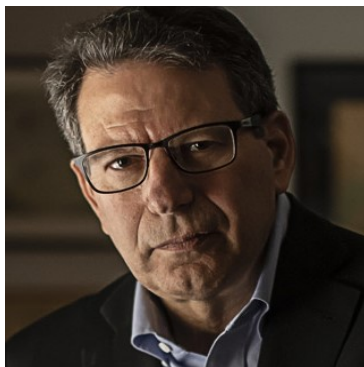
Figura 1 - Kaplan.

Guerra Fria, ao mesmo nível de The Clash of Civilizations , de Samuel Huntington, e de The End of History and the Last Man , de Francis Fukuyama. Vinte anos depois, Kaplan publicou a sequência Why So Much Anarchy? 5 . Também foi largamente discutido o seu ensaio Was Democracy Just a Moment? , publicado em Dezembro de 1997, como tema de capa da The Atlantic 6 , onde defendeu que a democracia em expansão em todo o mundo não conduziria necessariamente a mais estabilidade.