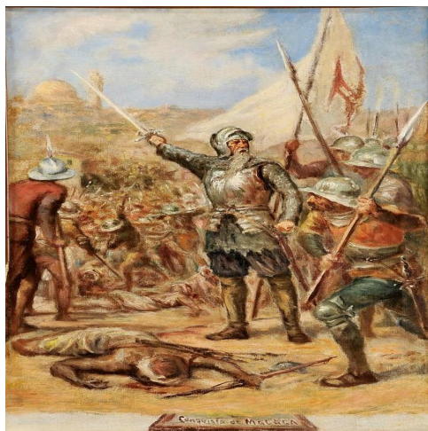
Figura 2 - Afonso de Albuquerque e a Conquista de Malaca.

Porém, na sequência da crescente contestação dos seus capitães, que reclamavam dos duros trabalhos e difíceis condições, vários navios desertaram para a Índia. Com a frota reduzida e sem mantimentos, Afonso de Albuquerque deixou Ormuz, em Abril de 1508, voltando a Socotorá.