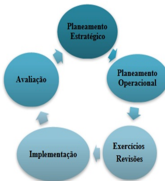
Figura 3 - Elementos-chave do ciclo de planeamento da preparação para resposta a uma pandemia.

Assim, a preparação para uma pandemia é um processo contínuo de planeamento estratégico e operacional, exercício, revisão, preparação e resposta. Um plano pandémico é essencialmente um documento dinâmico que é revisto a intervalos regulares e reajustado se houver uma mudança na orientação global, consoante as lições aprendidas, conforme esquematizado na figura 3 (European Centre for Disease Prevention and Control [ECDC], 2022).