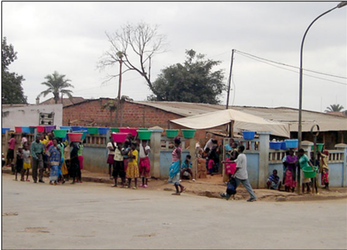
O lucrativo mercado da água

- 3.º Ela e a mãe (a anterior) viram-se a braços com gravíssimos problemas, como por exemplo em 2005 com o vírus de Marbourg e em 2006 com o surto de cólera no distrito do Uíje. Redobram os cuidados básicos com a saúde, área onde os preceitos tradicionais têm uma grande importância e o problema da água para a alimentação e higiene caseira, surge de uma forma capital, tornando-se então um lucrativo negócio.