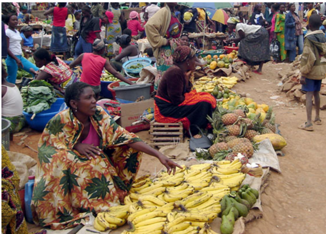
A vendedora de bananas

E este viver, subjectivamente ' mesmo assim ', foi-nos confirmado com as informações que obtivemos (2005) de pessoal de organizações humanitárias, de algumas instituições, órgãos do governo (Ministério da Agricultura) e dos nossos informadores-chave. Acrescentemos que desde o final da guerra (2002) a situação de grande risco das populações tende, visivelmente, a melhorar especialmente porque as vias de comunicação, pouco a pouco, vão permitindo a passagem de camiões de transporte de mercadorias. Infelizmente Maquela do Zombo continua a ter graves problemas no acesso rodoviário. As populações aproveitam então a estação seca para passar de uma cidade para outra apesar do receio das minas colocadas nas estradas e ainda não detectadas.