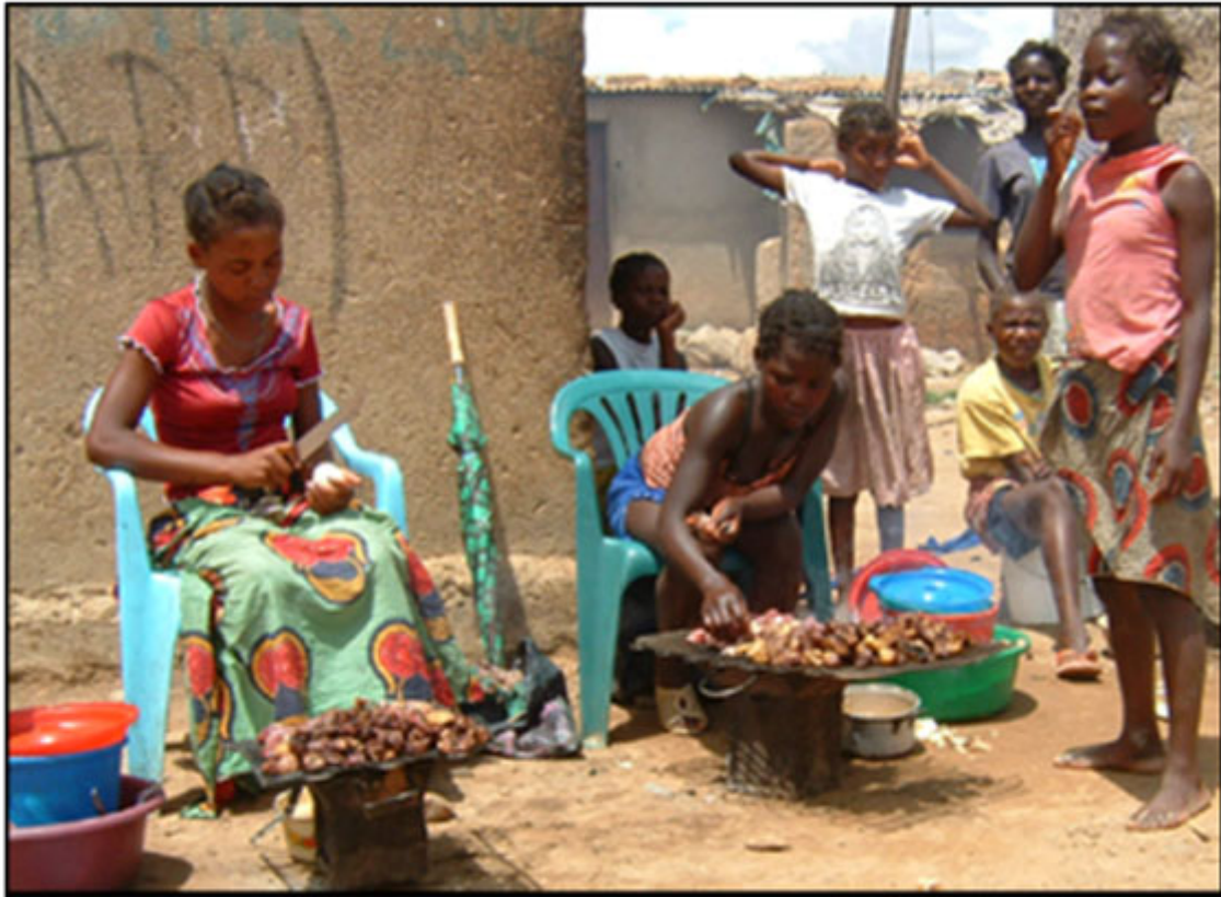
As jovens mães começam bem cedo a ter que praticar no nzandu .

A constatação de uma boa parte se ter confrontado muito cedo com a viuvez e outra parte já não poder contar com possíveis relacionamentos maritais passíveis de dar estabilidade aos filhos, faz com que venham ao de cima forças de que não suspeitavam, conseguindo frequentemente rasgos de liderança para os esquemas mercantis ao seu alcance. O mesmo acontece com as mulheres sós. Estas oferecem a sua ajuda às anteriores viúvas e mulheres casadas.