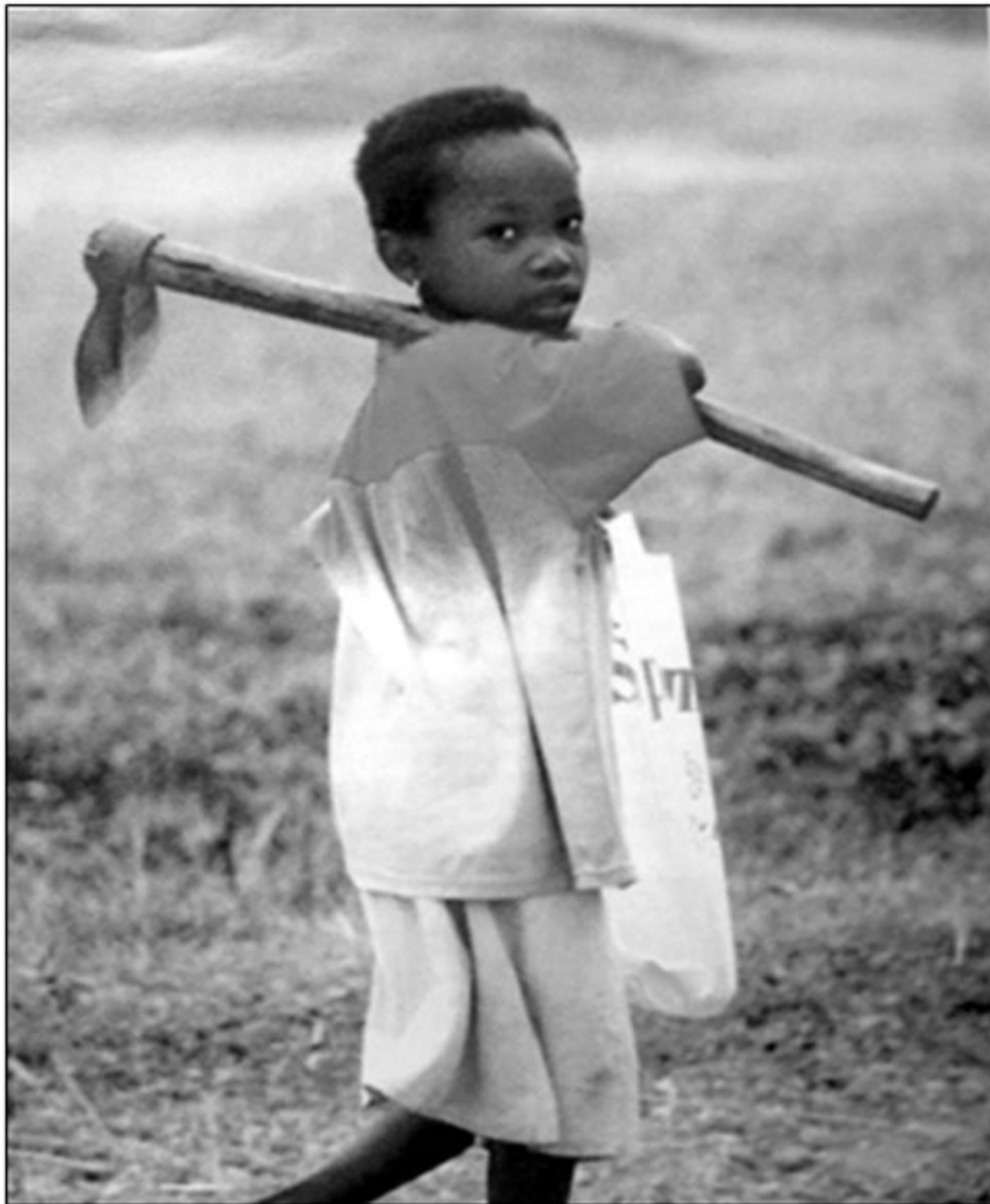
O menino zombo vai à escola de sacola e enxada ao ombro.

Face às anteriores descrições, imagine-se o que seria procurar água e comida para que, os milhares de refugiados que ali eram acolhidos, sobrevivessem. O padre Mariano ajudava também as equipas de desminagem da ONU a tentar inutilizar as minas escondidas, no solo, especialmente as colocadas entre o aeroporto de Maquela e a estrada que liga o posto fronteiriço (desactivado) de Banza Sosso e a fronteira. É com ele que os técnicos, seja de que área for, contam para prosseguirem no seu trabalho.