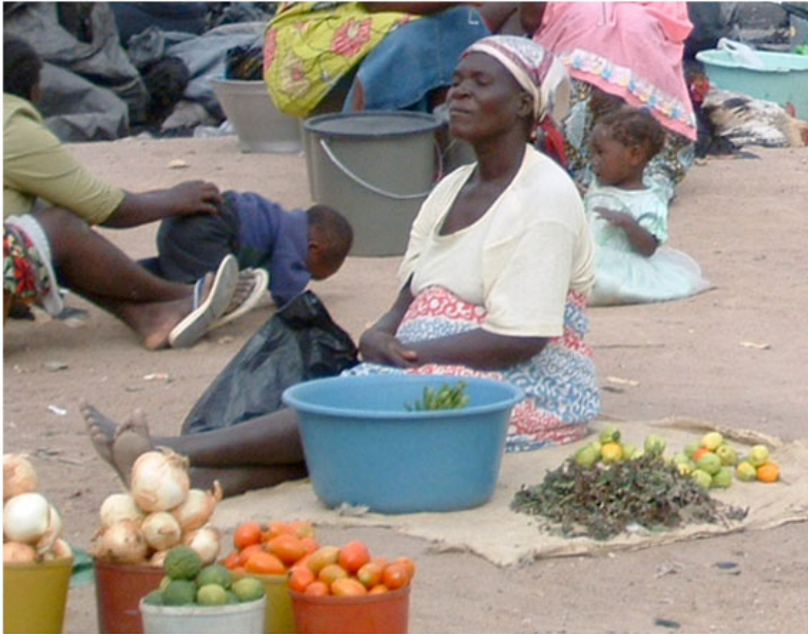
A sexagenária e o seu pequeno lugar , o ananás o caju, os tomates e pouco mais.

- 2.º A verdadeira chefe da família, (no nosso entender), é aquela que consegue a leitura do passado e dele se serve para consertar o presente precário, ou seja, a mulher que ronda os quarenta anos. A sua maior característica continua a ser a de saber equacionar o problema da instabilidade familiar resultante dos parcos meios de que dispõe e com eles orientar o seu lar. Adapta-se ligeira, às novas realidades. Com o casamento tradicional a que acrescentou por vezes o católico ou protestante, continua sendo, com o seu comércio particular, o suporte da família embora subordinada ao sistema ancestral. A sua idade indicia um breve e infantil passado colonial a que junta a árdua ajuda prestada ao serviço da independência nacional. Depara-se com uma vida vivida na companhia de alguns companheiros. Todos eles inimigos uns dos outros e muitas vezes da mesma família consanguínea. Já foram educadas na cultura do “ esquema e da gasosa ”, onde vale tudo para conquistar um lugar ao sol. Têm sempre presentes as formas por elas concebidas para fugir ao controlo dos homens, no que se refere aos seus parquíssimos ganhos, uma vez que aqueles se tornaram, não só inúteis como inoperativos, no que concerne à receita familiar.