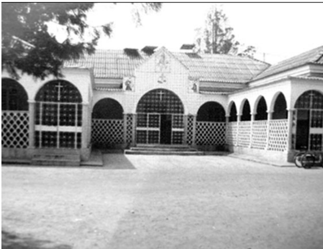
Missão Católica de Maquela do Zombo.