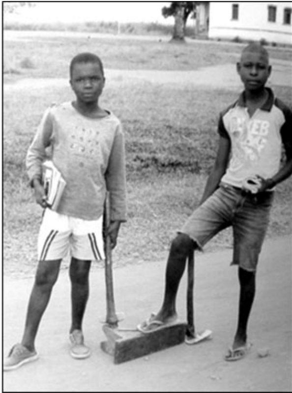
Estes são os jovens referidos acima, em Sosso. (antiga 31 de Janeiro)

Estes ‘malucos motoqueiros’ registaram, no seu documento, que o único lugar onde havia protecção e condições para pernoitar era na missão católica (2003), que funcionou como porto de abrigo, ao longo da guerra, desde a independência até ao fim.