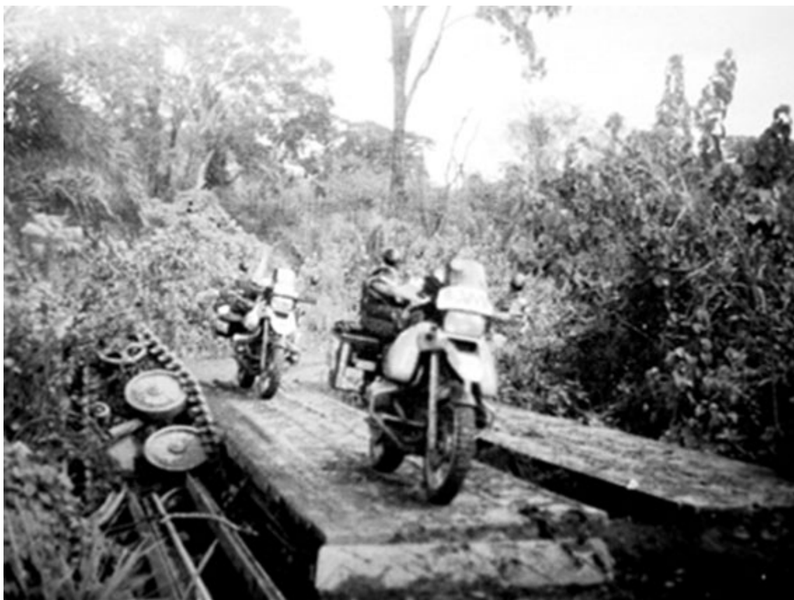
Tem a origem da anterior (2003). A ponte já é militar.

Finalmente a ponte do Nzadi, construída pelos portugueses foi destruída, o povo, mais uma vez, foi quem voltou a sofrer.