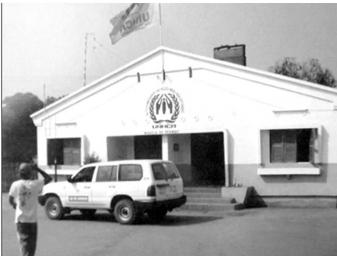
Instalações da ACNUR, em Maquela do Zombo, 2003.

Também nesta secção, convirá, antes do mais, lembrar que parte das populações refugiadas junto das suas famílias e residentes na fronteira política do espaço Zombo, bem como as que se dirigiram às zonas periféricas da cidade de Kinshasa, foram ao longo dos anos, interiorizando o demorado processo de adaptação e integração, facilitado pelo apoio dos seus familiares, residentes de longa data, em todo o chamado 'Bas Kongo' (Nsi Kongo) da República Democrática do Congo. Isto significa que o seu regresso não podia ser tão linear como possa parecer, à primeira vista, uma vez que envolve, ainda hoje, no mínimo, a deslocação geográfica de duas gerações.