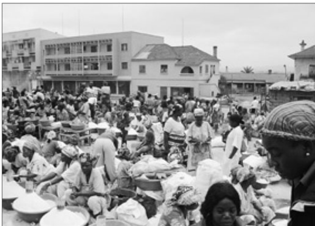
Fotografia do mercado central do Uíje em 2005. O comércio das mamãs .

As mamãs de hoje são o reflexo das ancestrais protagonistas dos nzandu ou praças de mercado e continuam a ser o elemento principal da compra e venda, não só entre os zombo, mas em toda a África negra. Nestes locais, exercitam diariamente o seu pendor ancestral para o 'negócio', aproveitando o tempo para colocar em dia as suas relações