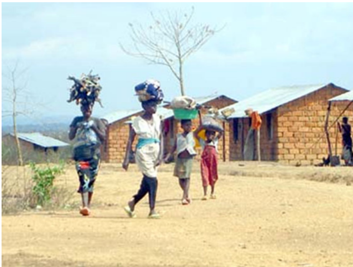
As três gerações à saída de casa

O processo que as obriga a atingir a idade adulta, sujeita-as a diversos ritos de passagem ao longo da vida. Para uma melhor compreensão do fenómeno, organizámos, operacionalmente, os diferentes patamares do processo vivencial em ritos de passagem por classes etárias e subsequente desempenho mercantil. Este nosso conceito operacional não invalida outro tipo de projecções sobre o mesmo assunto. Trata-se, como referimos, de uma opção operacional do estudo à qual nos adaptámos: