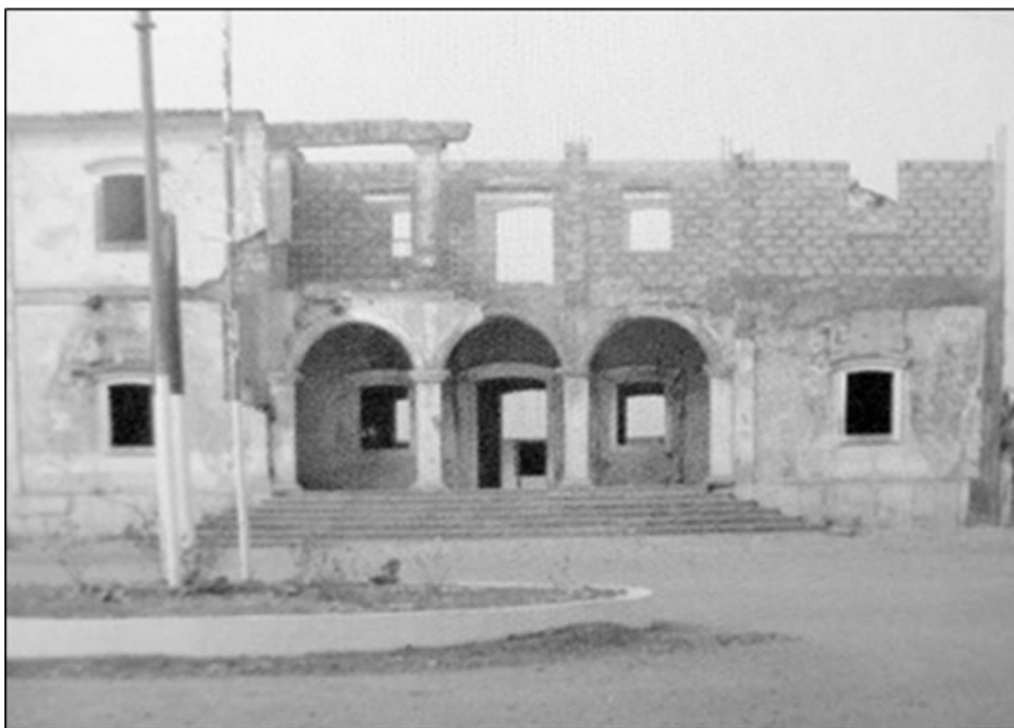
As instalações da antiga Câmara Municipal

Antes de nos debruçarmos propriamente sobre a independência de Angola e a guerra pelo poder político, no seio dos zombo, parece conveniente dedicarmos um último apontamento aos europeus ali residentes, sendo alguns filhos dessas mesmas terras. Sabemos que as palavras que proferimos ou escrevemos levam, ainda hoje e, por vezes, a