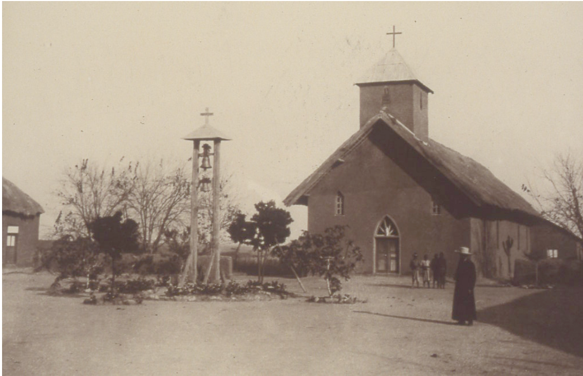
Cassinga, 1910

Bastou que falecesse, entretanto, Eyulu, amigo dos missionários, e logo todos se declararam imediatamente contra os brancos. Recorde-se ainda que assim que um monarca falecia, congregava-se uma enorme multidão em volta da embala (digamos a casa real do monarca) para saber o que diriam os conselheiros sobre o reinício das hostilidades, neste caso contra os europeus, visando especialmente militares e missionários. Nessas reuniões ouviam-se quantos quisessem falar e imediatamente se ouvia o grito: “É urgente matá-los, pelo menos expulsá-los”. Afirmavam mesmo alguns que a causa da morte de Eyulu eram os padres. Não podemos esquecer que os lenga (os “generais”) perderiam grande parte do seu prestígio junto das suas linhagens e respectivos clãs se vissem diminuída a sua autoridade.