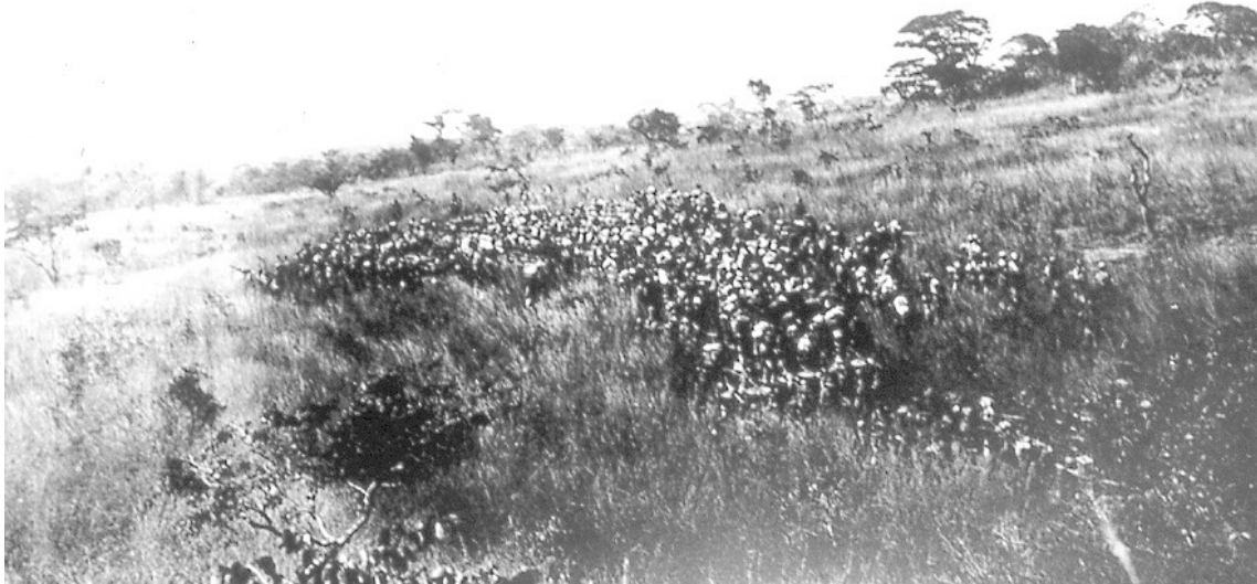
Progressão em quadrado em terras Ovambo, 1907, fotografia de Veloso e Castro

Se não fosse o legado fotográfico de Veloso e Castro como poderiam os investigadores (aqueles que investigam com base na informação fotográfica) analisar 100 anos depois, o que então se passou? Seriam realmente suficientes os relatórios dos comandos operacionais matéria convincente para suporte da análise crítica dos documentos? Não. Porém, desde que a fotografia começou a fazer parte da tecnologia de ponta dos serviços de informação, será que se pode prescindir dela como fonte dos acontecimentos na frente de combate?