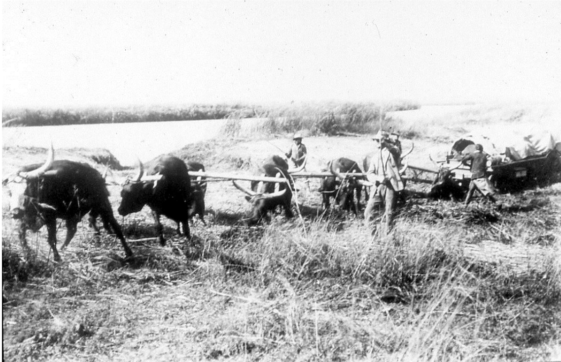
Passagem forçada de um carro Boer , fotografia de Veloso e Castro, 1910

Antes de mais, recordo que este tema já foi objecto de publicação no nº 2447, de Dezembro de 2005, na Revista Militar. Aqui, o propósito é dar mais uma contribuição ao assunto e enquadrá-lo num contexto mais alargado e complexo.