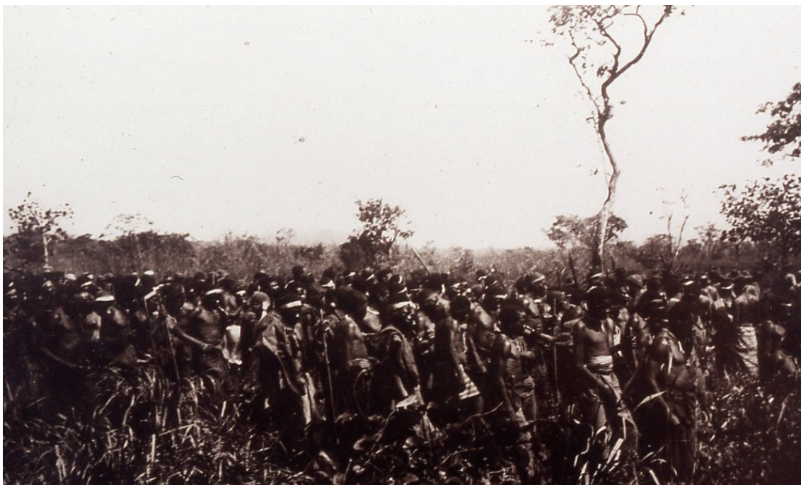
Progredindo em formação de quadrado , Fotografia de Veloso e Castro, 1910

A primeira vez que deparei com a fotografia acima, francamente não a entendi. Creio não estar confundido se aquele aglomerado de militares não esteja a progredir no terreno em formação de quadrado. Que diferença...Tal como aconteceu com a primeira fotografia sobre o “quadrado”, ao deparar com o instantâneo acima, já me não preocupei com forma como os homens estavam dispostos no terreno. Algo me chamou a atenção, o que tinham eles à volta da testa? Era uma tira de pano.