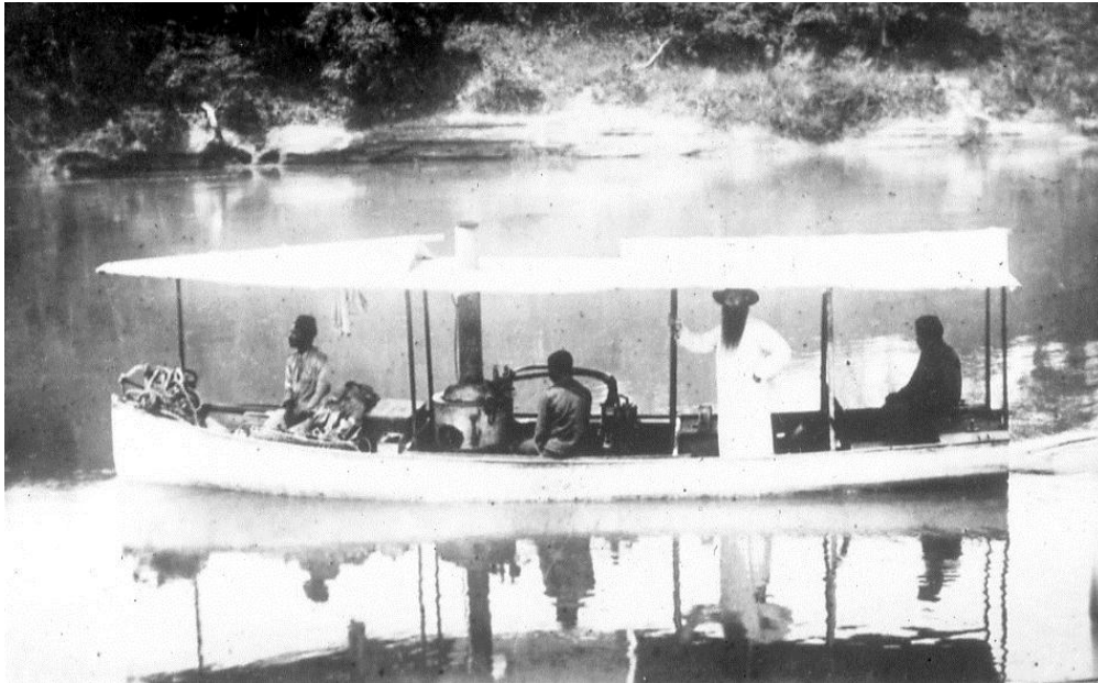
Fotografia de Veloso e Castro, 1905

O Padre Duparket, como descobridor do rio Cuvelai em 1879, era na altura superior da Prefeitura da Cimbebásia, colónia inglesa do Cabo e fundou uma missão católica no Kuanhama. A missão não teve êxito e terminou em 1884 [6] .