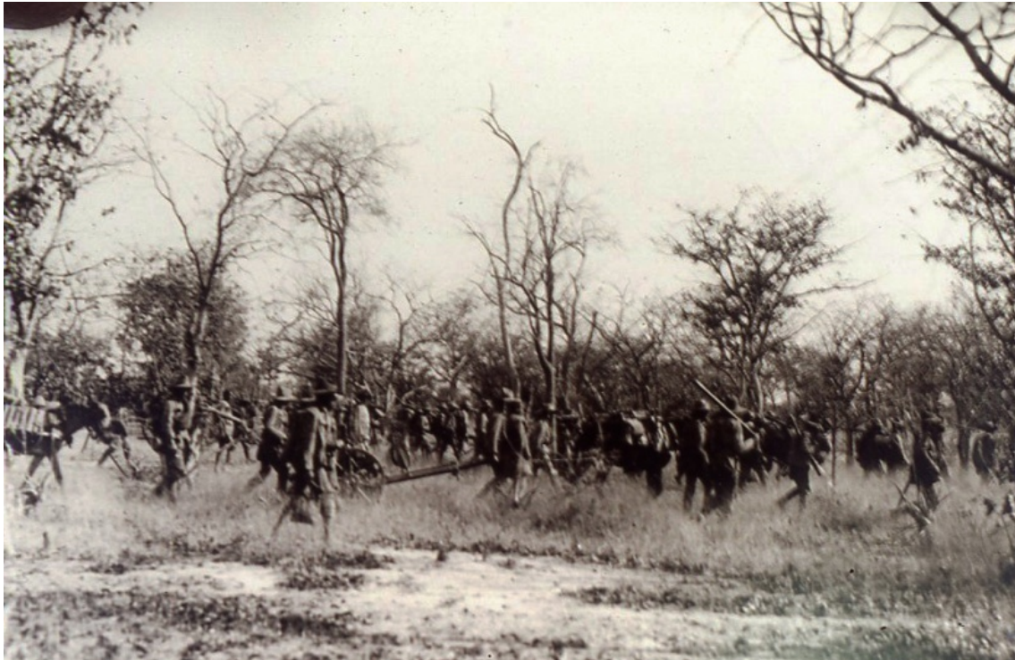
Progressão em quadrado no Kuamato, fotografia Veloso e Castro, 1907

De lá para cá fiz duas viagens ao Norte de Angola. Uma em 1991, para a preparação da dissertação de mestrado O Comerciante do Mato , publicada pelo Departamento de Antropologia da Universidade de Coimbra em 2000. Outra, em 2005, ao distrito do Uije, para finalizar e actualizar os dados fundamentais da vida dos Zombo como inveterados comerciantes internacionais e não só. Neste contexto penso que a síntese do currículo é pertinente e resulta a meu favor no que se refere ao desenvolvimento deste documento. Como se percebe já vêm de longe as aventuras e desventuras dos portugueses que por esse mundo fora padeceram.