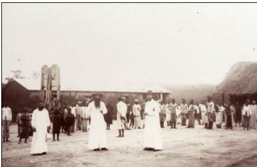
Fotografia de Veloso e Castro, missão de Mussuco, 1905

Contra estes considerandos nada os cuanhama poderiam opor, senão resignar-se. Mas atenção, venderam muito cara essa submissão, como veremos. Aqueles tempos, eram tempos de chão sagrado, chão regado pelo sangue das linhagens e dos clãs habituados a permanentes confrontos por causa do gado e das mulheres. Era o tempo em que o padre Schaler sucedeu ao padre Lecomte. Por essa altura, a Cúria Romana dividia estrategicamente a imensa Prefeitura da Cimbalésia Superior confiando-a aos PP. do Espírito Santo [9] .