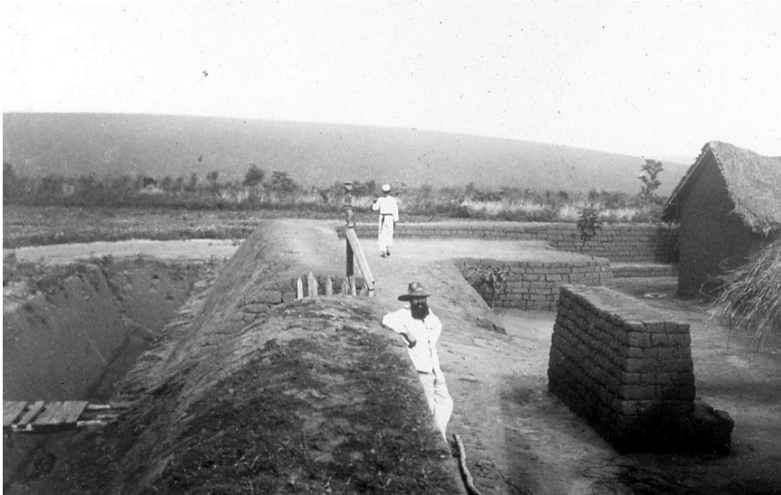
Forte D. Carlos I, Tembo Aluma, 1905, fotografia de Veloso e Castro