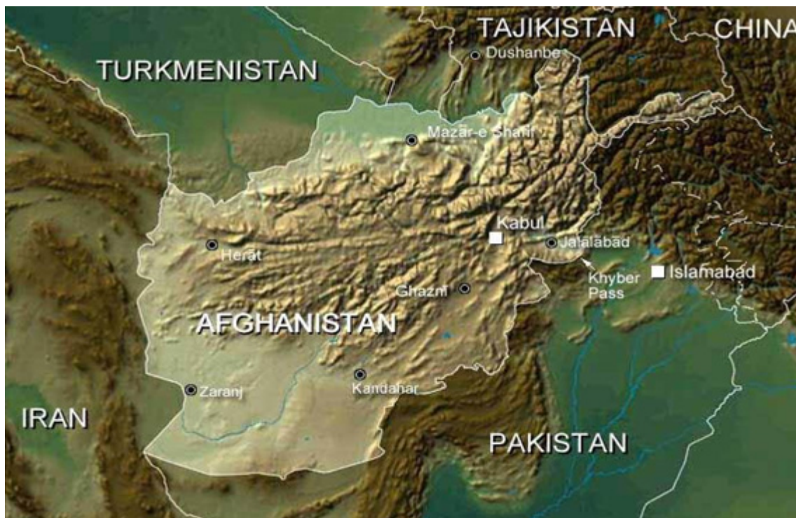
ANEXO 1. Mapa do Afeganistão no contexto regional