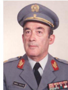
Tenente-general Abel Cabral Couto