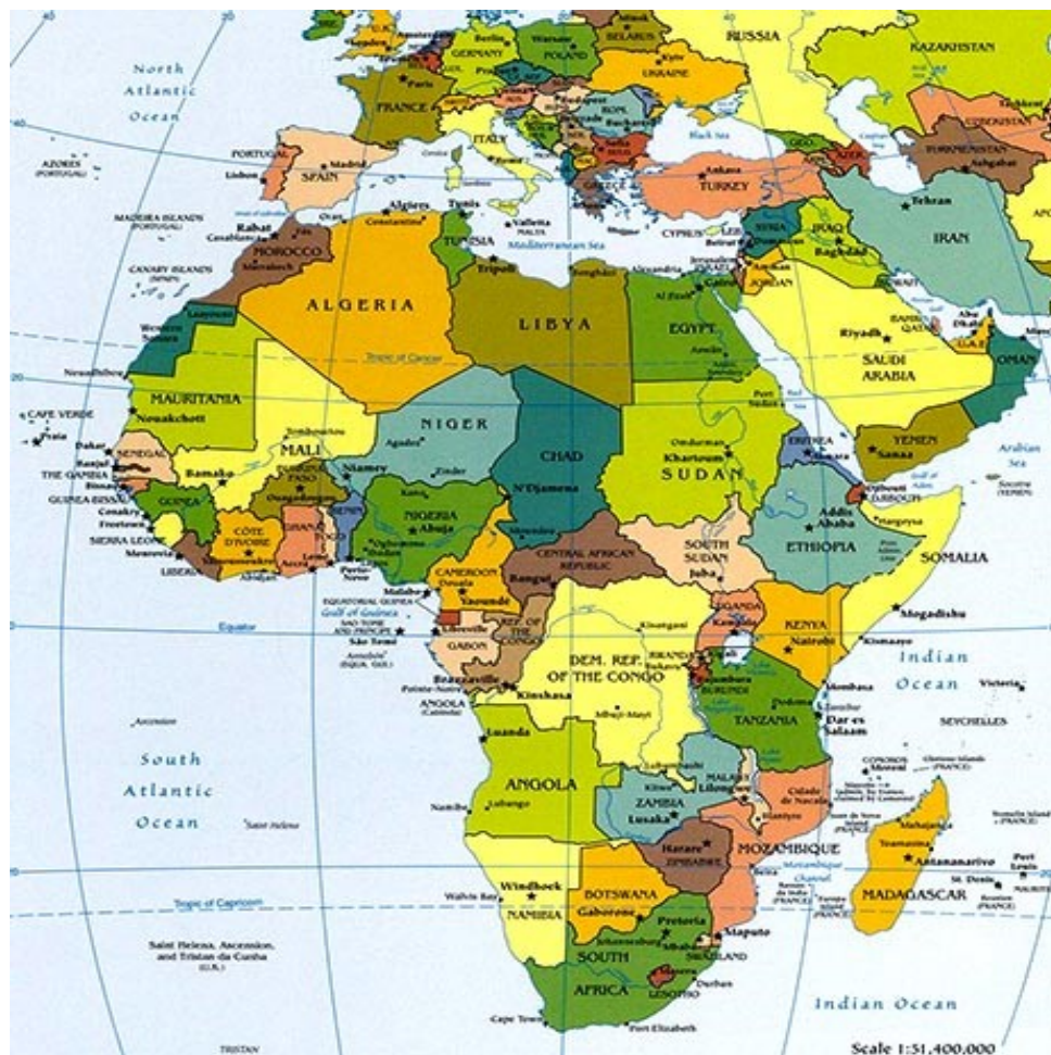
Mapa 1 - África 42

Dividida em cinco sub-regiões - Ocidental, Oriental, Central, Sul e Corno de África -, após o fim do colonialismo europeu, a região da África Subsariana serviu de palco às disputas das duas grandes potências que se opunham na Guerra Fria, os EUA e a União Soviética. Em resultado das acções soviéticas, a região, tradicionalmente ligada ao domínio marítimo, emergiu nesta fase, precisamente, como um Shatterbelt 43 . Neste contexto, muita energia foi direccionada para a África Subsariana por parte dos domínios marítimo e continental, com o principal objectivo de proteger ou obter fontes de recursos materiais, aceder a mercados e impedir o estabelecimento de bases militares inimigas 44 .