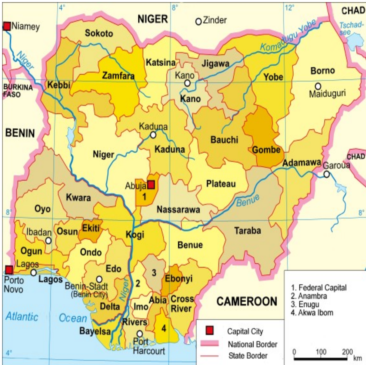
Mapa 2 - Nigéria: os 36 estados e a capital federal 68

Situada na já mencionada Zona de Compressão que se estende do Corno de África até à África Ocidental, mais concretamente no Golfo da Guiné, a Nigéria é o maior Estado africano em termos populacionais, com cerca de 170 milhões de pessoas que se dividem por mais de 250 grupos etnolinguísticos. É composto por trinta e seis estados federados que se dividem por seis zonas geopolíticas (Sudeste, Sul-Sul, Sudoeste, Nordeste, Noroeste e Norte Central), a que acresce a capital federal, Abuja, que, segundo Kalu N. Kalu, dada a parca força e efectividade política dos estados federados, é de onde emana a maior parte das políticas públicas, pelo que o federalismo nigeriano acaba por “reflectir