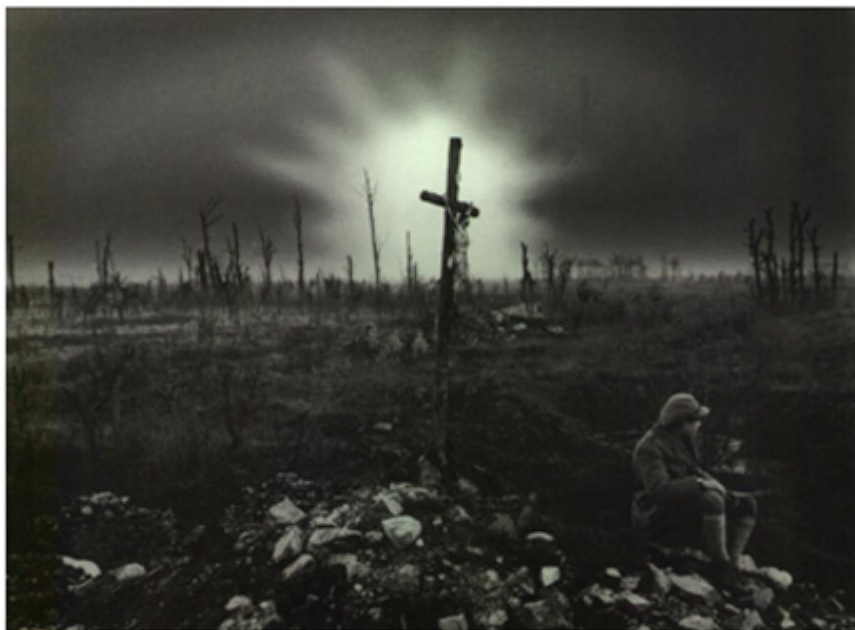
Figura 4 – Em Neuville Chapelle erguia-se o chamado "Cristo das Trincheiras"