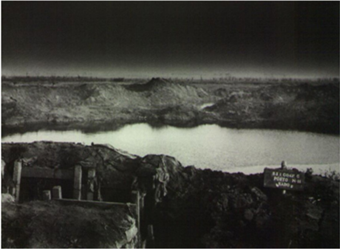
Figura 5 – Terra de Ninguém