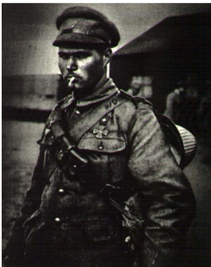
Figura 1 - Soldado Português do RI 7 condecorado com a Cruz de Guerra