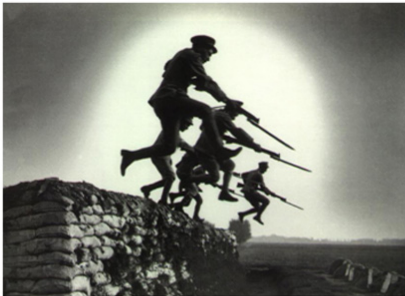
Figura 3 – Exercício de Assalto à Baioneta – Campo de Instrução Central em Marthes.