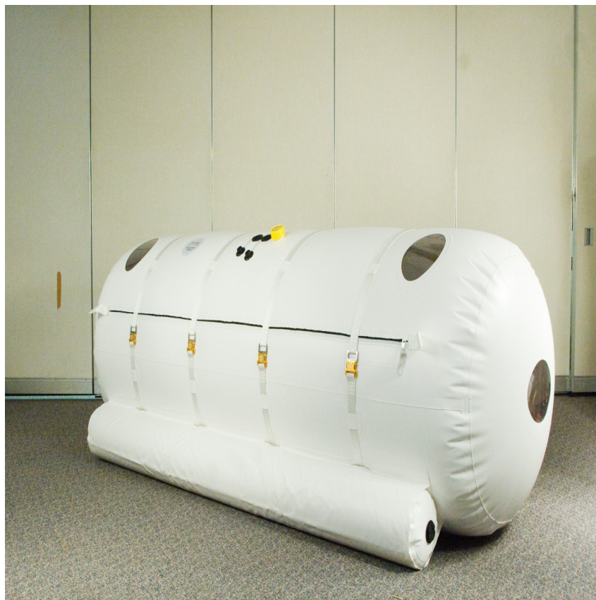
Figura 1 - Câmara hiperbárica portátil