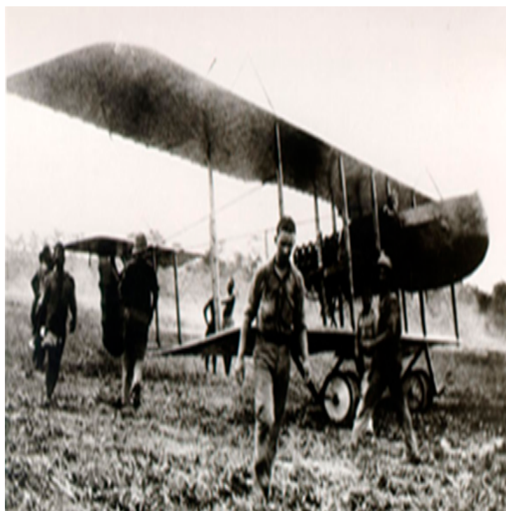
Figura 2 - Os FARMAN F-40 , no Norte de Moçambique - 1917/1918.