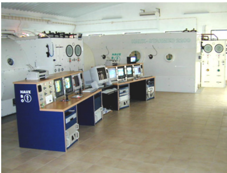
Fig.1: Câmara hiperbárica multilugar

Dividem-se por várias categorias, de acordo com a sua capacidade, finalidade de utilização e potencial terapêutico: