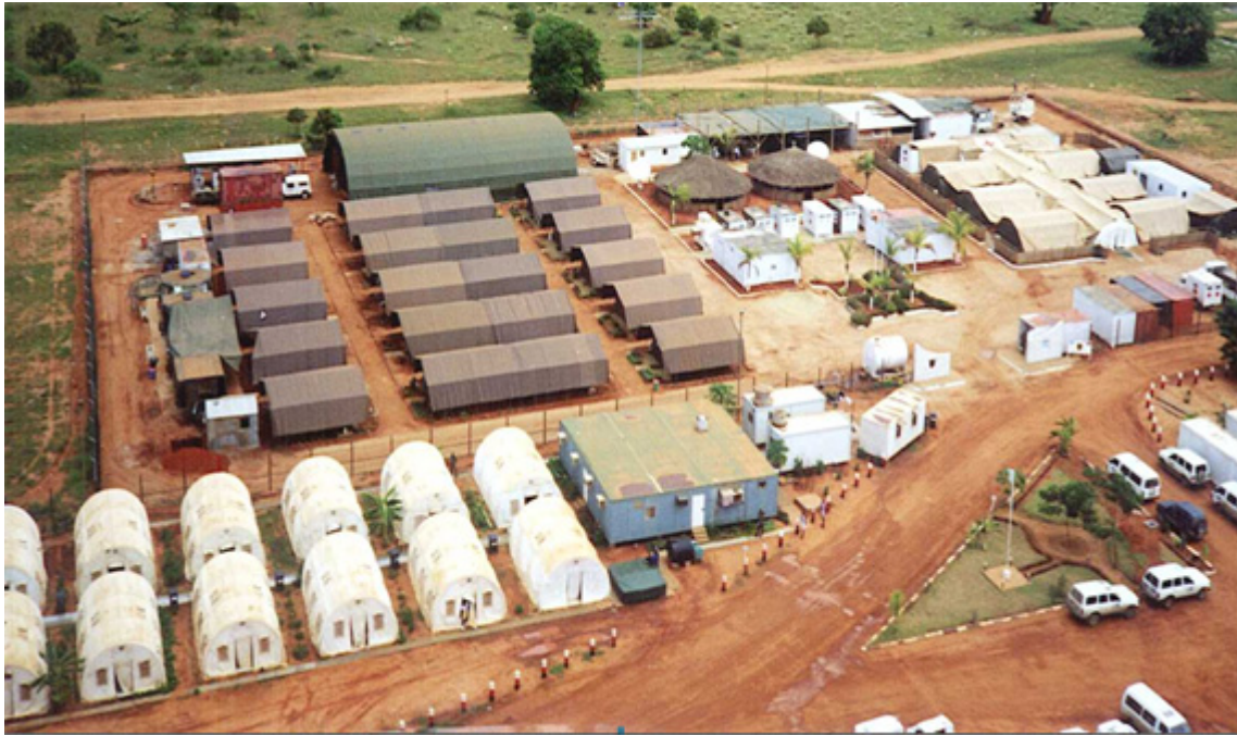
Fig 3 - Destacamento Sanitário 7 MONUA, 1997.