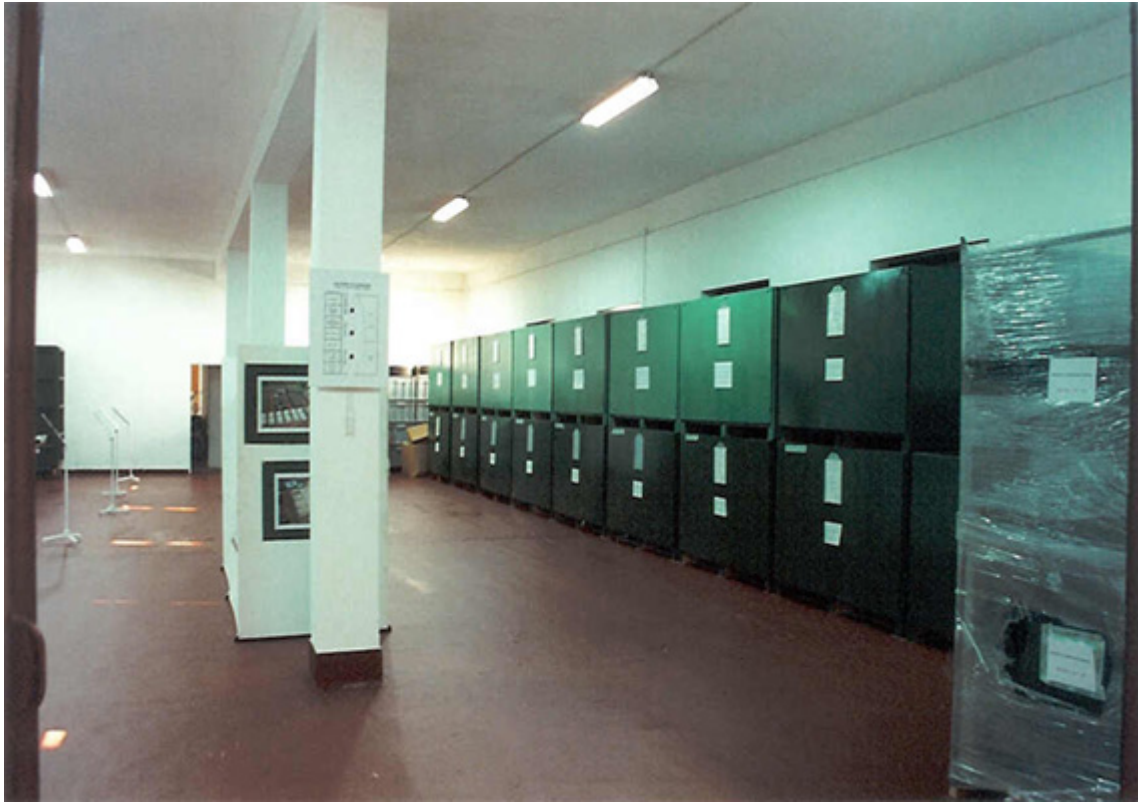
Fig 6 - Reserva sanitária de equipamentos para o Hospital de Campanha.