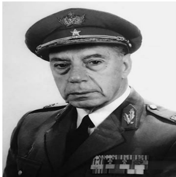
Tenente-general José Lopes Alves

(7 de julho de 1924 - 30 de maio de 2018)