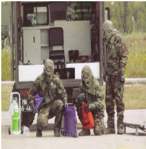
Figura 1 - O Elemento de Defesa Biológica e Química do Exército: exemplo de superespecialização.

Dentro das diversas áreas da Saúde Militar, no entanto, tal como ocorre na Sociedade Civil, é preciso ter em conta uma crescente superespecialização, não sendo aplicável, a nosso ver, o modelo de outrora em que um médico, um veterinário, um médico-dentista, um enfermeiro, etc., é deslocado por escala geral ou destacado para funções díspares, independentemente das suas competências específicas. Este aspecto trará ou deve trazer, naturalmente, repercussões nos dois seguintes pontos de análise/reflexão.