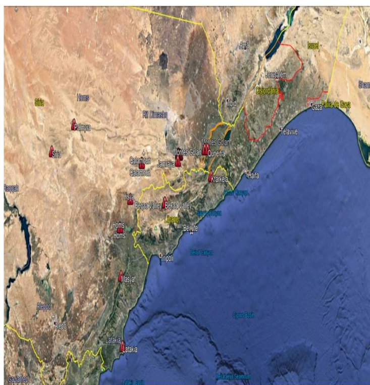
Figura 2 - Localização dos ataques israelitas.

A análise às intervenções militares israelitas demonstra bem a vontade e a capacidade por parte de Israel em atacar preventivamente as capacidades iranianas e sírias à medida que emergem no teatro de operações, antes de amadurecerem como uma ameaça significativa, bem como a sua prontidão para atacar diretamente as forças iranianas e expor o envolvimento e o modus operandi do Irão. Não há dúvida de que o apoio da administração americana e a articulação operacional com a Rússia são um componente importante no espaço operacional (Orion, 2018), sem o qual seria extremamente difícil intervir no território sírio.