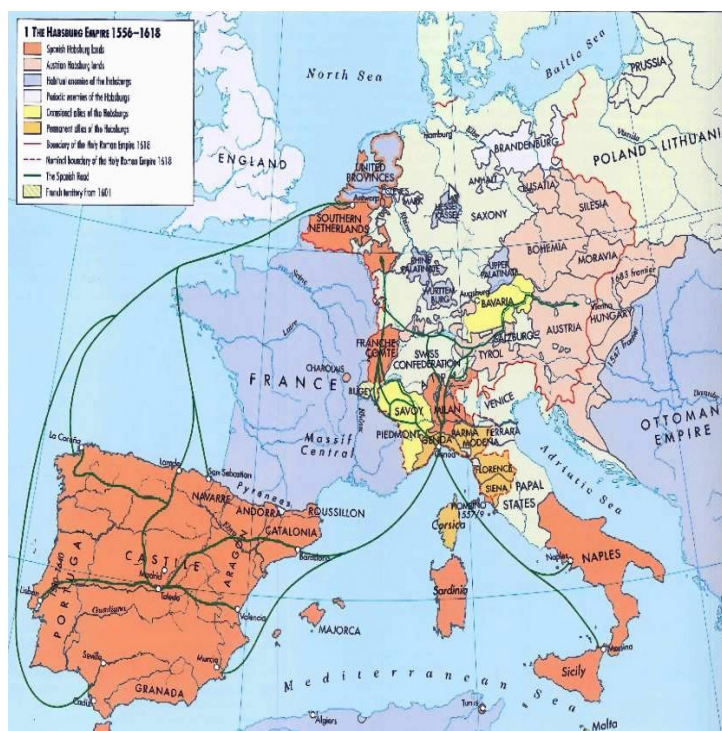
Figura 1 - O Império Habsburgo na Europa (1556-1618) [5] .

debateu, potenciadas não só pelo tamanho e dispersão territorial dos seus domínios, mas, também, pela distância entre estes. Deve ressaltar-se o potencial de conflito que aqueles interesses encerravam, não obstante a predisposição defensiva e reactiva afirmada por uma coroa que repetidamente declarava não ter ambições expansionistas [4] .