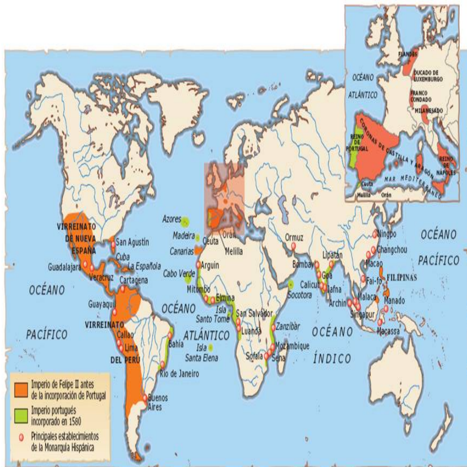
Figura 2 - O Império de Filipe II, antes e depois da incorporação de Portugal. [7]

O lamento de Martín de Padilla, proferido em jeito de conselho a Filipe III de Espanha, após a morte de seu pai, reflecte até que ponto o império espanhol se viu envolvido em guerras desgastantes e prolongadas. E como estas se deveram, em parte, a insuficiências económicas. Não obstante, como o próprio Padilla reconhecerá noutros escritos [8] , os constrangimentos e limitações que impediram o sucesso absoluto do «império onde o sol nunca se punha» não ficaram a dever-se apenas à falta de dinheiro, radicando, também, nas respostas que aquele procurou dar às ameaças que foram surgindo.