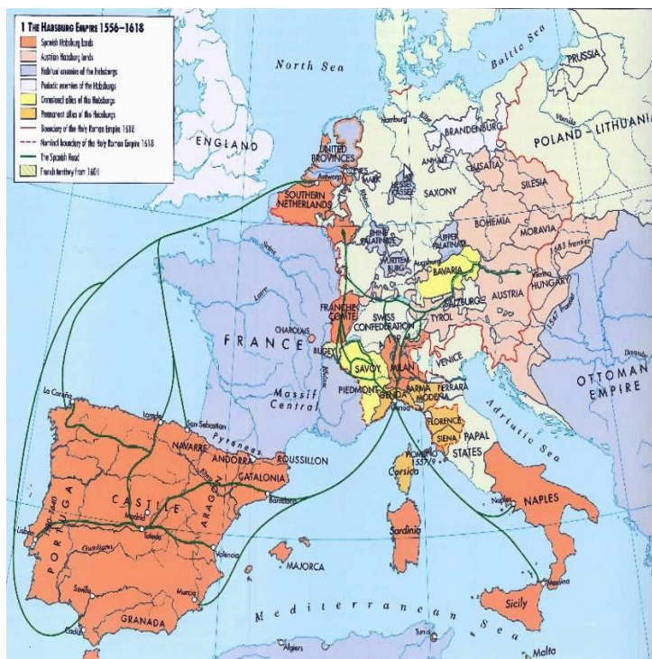
Figura 1 - O Império Habsburgo na Europa (1556-1618) [5] .

debateu, potenciadas não só pelo tamanho e dispersão territorial dos seus domínios, mas, também, pela distância entre estes. Deve ressaltar-se o potencial de conflito que aqueles interesses encerravam, não obstante a predisposição defensiva e reactiva afirmada por uma coroa que repetidamente declarava não ter ambições expansionistas [4] .