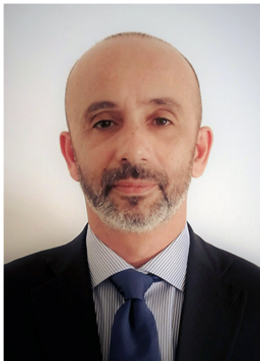
Mestre Pedro Gomes Sanches

«U.S. President Donald Trump lashed out at European allies before a NATO anniversary summit in London on Tuesday, singling out France’s Emmanuel Macron for “very nasty” comments on the alliance and Germany for spending too little on defence.» [1] 2019