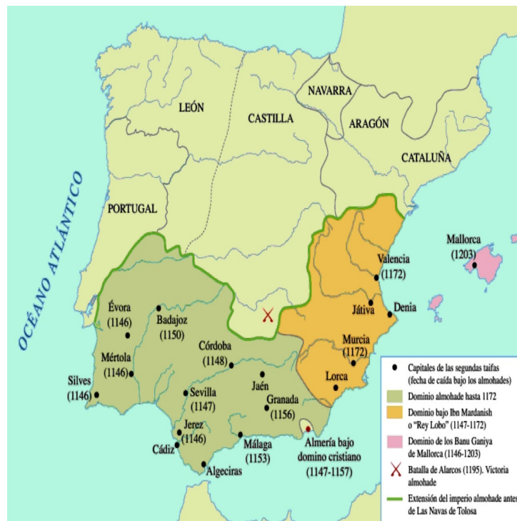
Mapa 1 - Esforço almóada pelo controlo do al-Andalus, na segunda metade do século XII.

A fronteira entre os mundos cristão e muçulmano era um espaço vasto, que se mantinha durante algumas gerações, até que o dinamismo conquistador de um dos lados ocupava e consolidava território, deslocando essa faixa para uma outra área. Quando Afonso Henriques protagonizou a secessão face ao reino de Leão, em 1128, a fronteira do Portucale com o mundo islâmico era todo o território entre o Mondego e o Tejo. Depois da conquista de Santarém e Lisboa, em 1147, a faixa de fronteira deslocou-se para sul, passando a abranger toda a área entre o Tejo, o Algarve e o Guadiana, ou seja, correspondente aos atuais Alentejo e Estremadura Espanhola. Encravada durante muito tempo entre os poderes cristão e muçulmano, a região conheceu formas de autonomia muito acentuadas 10 .