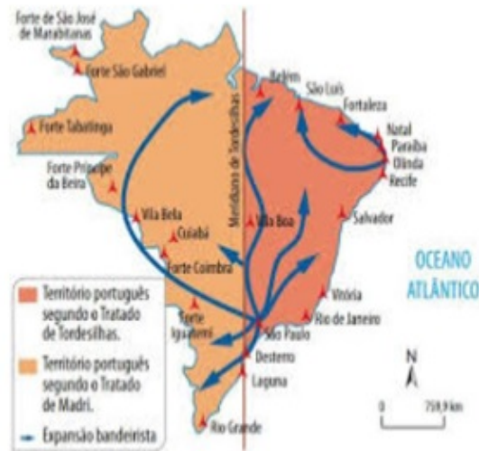
Figura 2 - O Meridiano de Tordesilhas.

Tal facto permitiu que os portugueses passassem a circular livremente a oeste da linha de Tordesilhas, um imenso território praticamente desconhecido, e ainda nas possessões originalmente espanholas. Os habitantes destas possessões no continente sul-americano tinham, por outro lado, muito mais dificuldades em caminhar para norte ou oeste por falta de efectivos e não haver riquezas conhecidas que lhes suscitassem o interesse e, sobretudo, por causa dos obstáculos geográficos existentes.