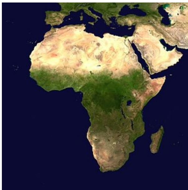
Figura 2 - Mapa físico de África.

o Sahara - 5,6 milhões de km 2 , quase tão grande como os EUA. O Sahara separa o Norte de África do resto do continente. A Sul deste encontra-se o Sahel (significa “fronteira”, em árabe), uma faixa de estepe arenosa semiárida, que atravessa todo o continente, da Gâmbia à Eritreia, zona de transição entre o deserto e a savana e a floresta tropical (figura 2). À excepção do Norte, o continente desenvolveu-se separadamente da massa eurasiática, em que as ideias e as tecnologias transitaram ao longo dos meridianos e não dos paralelos.