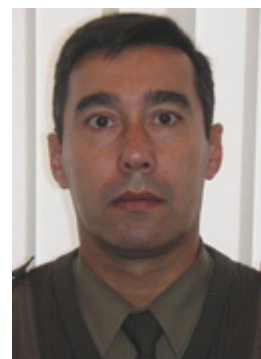
Tenente-coronel Agostinho Aguiar Pinto Janeiro