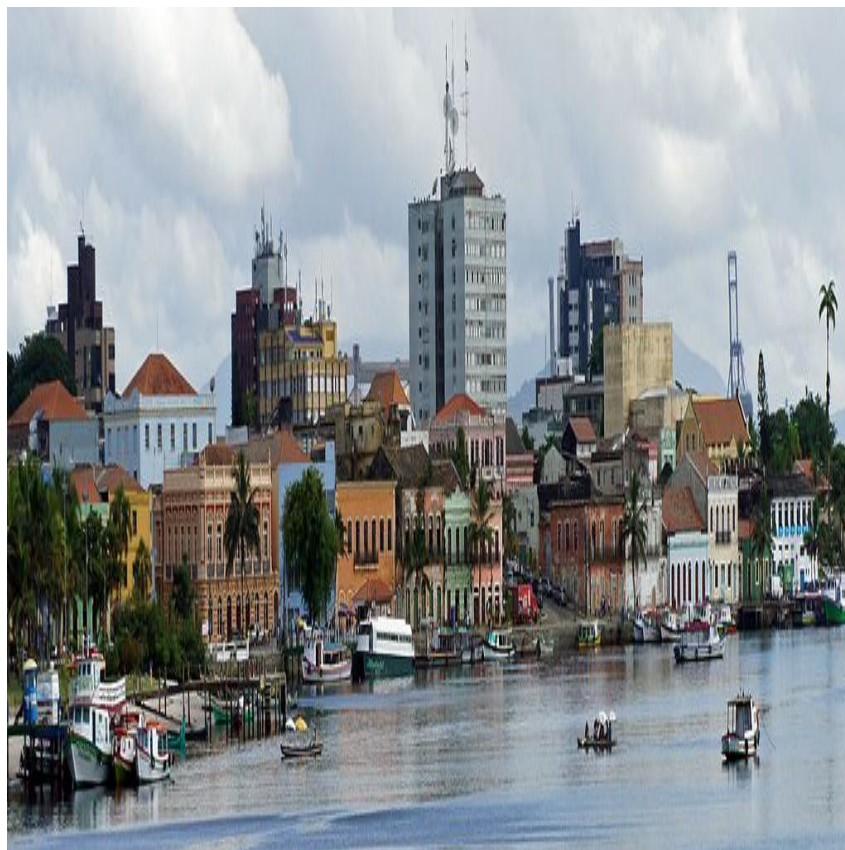
Figura 4 - Vista geral de Paranaguá, estado de S. Paulo, Brasil.

Teve aí opulenta casa, mas arruinou-se ao serviço do descobrimento e reconhecimento dos vastíssimos sertões de Tibaji, nos quais o Governo português se mostrava muito interessado, por se supor que existiam aí vastos recursos minerais 6 .