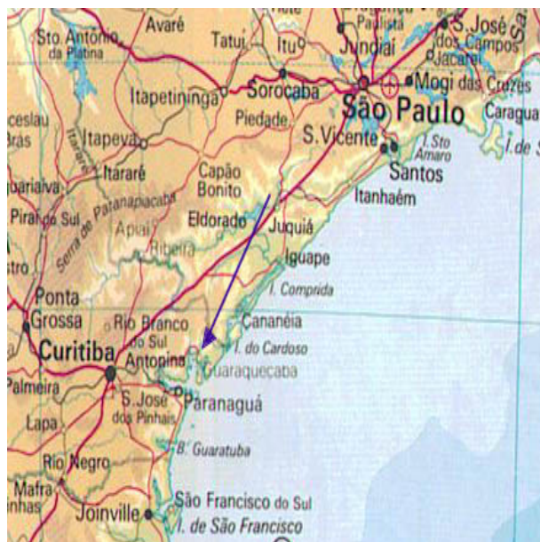
Figura 1 - Localização de Paranaguá, S. Paulo, Brasil.

Apenas conseguiu recuperar a liberdade após 8 anos de cativo, e depois da assinatura de paz celebrada entre Portugal e Espanha, em San Ildefonso (1777), conduzindo à sua custa por terra numa longa marcha de 180 léguas, 134 prisioneiros portugueses das guarnições da colônia de Sacramento e de S.ta Catarina. Regressando à capitania de S. Paulo, acabou a sua vida reformado no posto de Sargento-mor (em 1807), não sem antes ter obtido uma carta de brasão de armas a 3-8-1781; conseguiu ainda uma audiência da soberana, a Rainha D. Maria I de Portugal, que o mandou continuar no mesmo posto de Capitão exclamando «que se não podia esperar mais dum vassalo do que ele tem feito»; e de requerer sem sucesso, como Capitão do Regimento de Cavalaria, a mercê do hábito de Cristo com a tença de 200.000 reis, que teve consulta favorável do Conselho Ultramarino e sanção régia da Rainha, mas que nunca lhe foi deferido (1781). O seu imenso esforço de mais dum ano, no comando duma expedição bandeirante armada à sua custa nos vastíssimos sertões de Tibaji no Paraná entre 17-11-1769 a 29-12-1770, de apenas um alferes, doze soldados e dois escravos, arrecadou para a jurisdição da Coroa portuguesa uma área superior a 420 léguas de terreno nos territórios americanos, no tratado de paz de Ildefonso, Espanha, em 1-10-1777, sem que com isto o Erário Público gastasse um só real 3 .