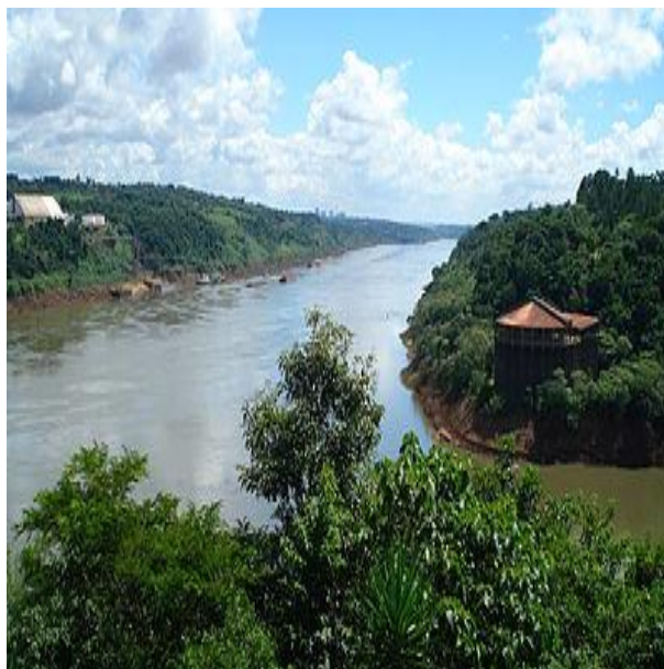
Figura 6 - Rio Iguaçu com a sua confluência com o Paraná.