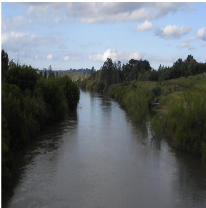
Figura 10 - Rio Tibaji, próximo da Ponta Grossa.

Quando foi preso, os espanhóis e o governador quiseram-lhe oferecer a patente de Tenente-Coronel com 200.000 réis de soldo, caso passasse ao serviço de Espanha para combater Portugal. Preferiu morrer, a pegar em armas contra a sua Pátria. Esta resolução heroica dissuadiu o governador espanhol, que respeitou, por fim, a vida do ilustre português, seu prisioneiro.