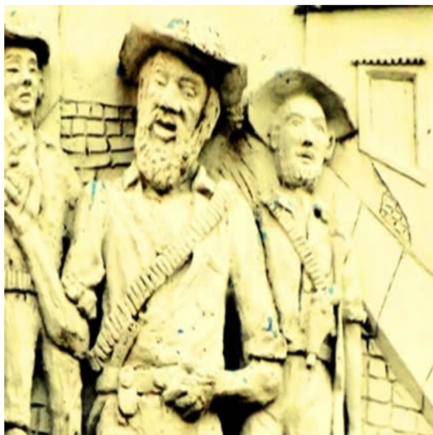
Figura 2 - Bandeirantes.

Este artigo procura realizar uma biografia de António da Silveira Peixoto (1734-1814), colocando no final uma grelha das linhas da sua carta de brasão de armas (1781) - Ávila, Bettencourt, Silveira e Peixoto, e ainda a descrição da mercê da mesma.