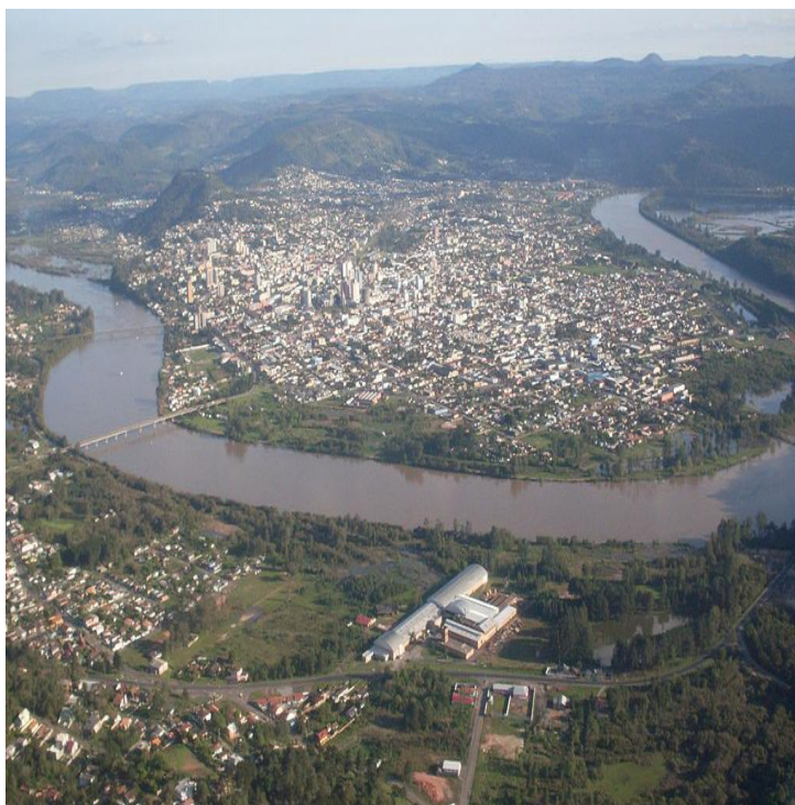
Figura 9 - Vista geral de União da Vitória, Paraná, Brasil.

Saiu a sua expedição, como se disse, do porto da Conceição no rio do Registo (Iguaçu), achando-se um mês depois no rio e barra de Pitinga, afluente da margem esquerda daquele outro e daqui, após uma pausa de alguns dias para se refazer e socorrer outra expedição que o procedeu, retomou caminho, chegando a 20-12-1769 ao porto do Salto, onde lançou os primeiros fundamentos de uma povoação, a que deu o nome de N. S.ra da Vitória (hoje União ou União da Vitória).