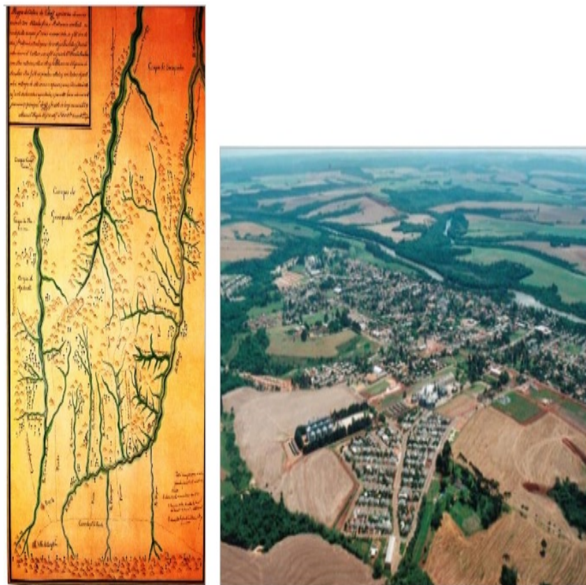
Figura 5 - Sertões de Tibaji, Paraná, Brasil

De qualquer forma, contava 32 anos quando, em 1769, tomou o comando da expedição como bandeirante aos sertões do Tibagi.