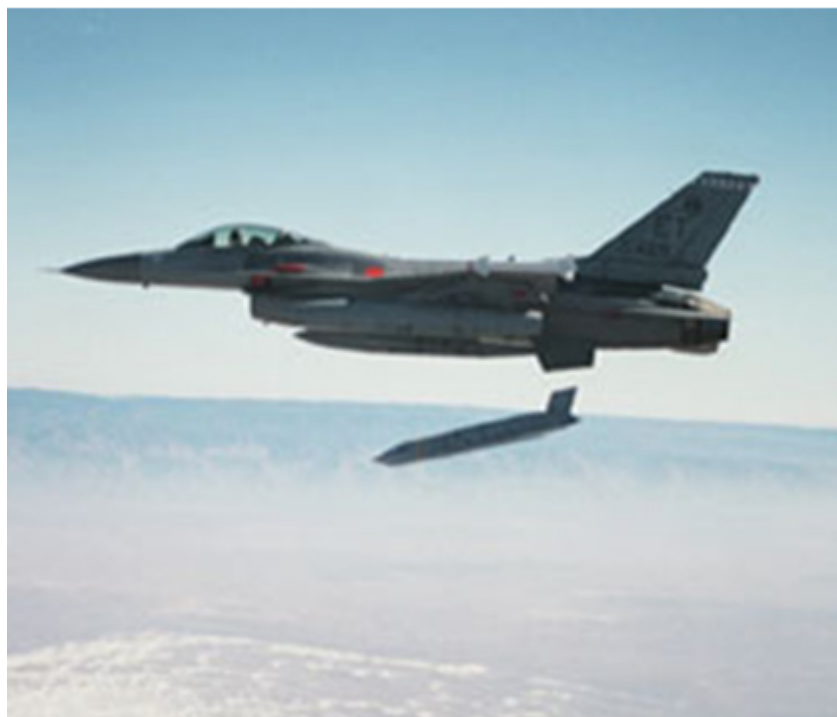
Figura 2 - Cça F-16 largando uma munição guiada por GPS.

Graças a essas potencialidades, as munições guiadas por GPS impuseram-se definitivamente na segunda metade da década de 90 e o primeiro ataque conduzido inteiramente com munições guiadas por GPS ocorreu a 3 e 4 de Setembro de 1996. Foi a operação Desert Strike , um raid ao Iraque em que quatro navios de superfície, um submarino e dois aviões B-52 lançaram 31 Tomahawks e 13 outros mísseis de cruzeiro sobre alvos iraquianos, como retaliação por ataques de forças iraquianas a rebeldes curdos 7 .