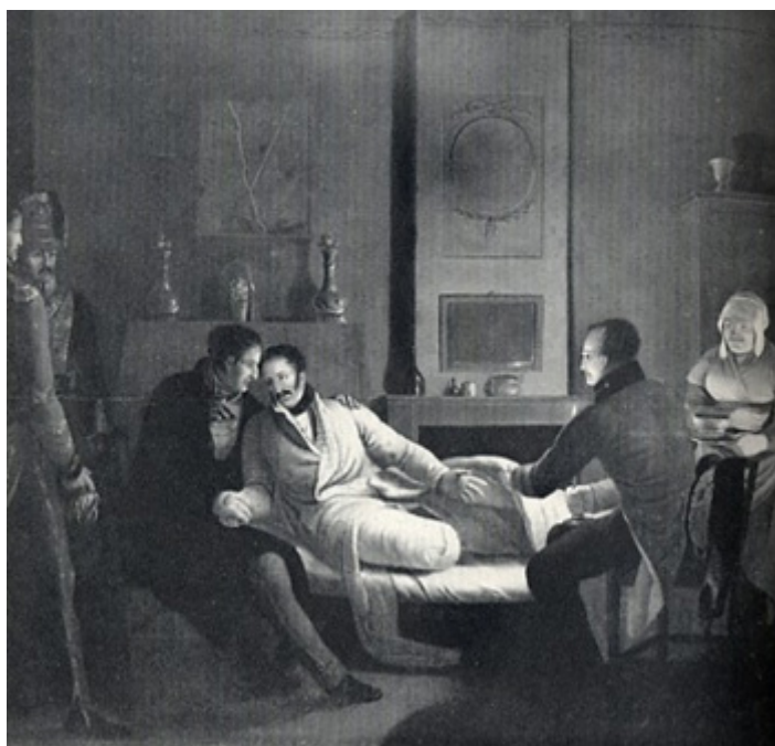
Fig. 8 - Lord Uxbridge, Marquês de Anglesey. Na Batalha de Waterloo contraiu um ferimento ligeiramente acima do joelho e teve que ser submetido a uma cirurgia de amputação da perna esquerda.

A mortalidade das amputações dependia da capacidade e experiência do cirurgião, do momento em que o paciente chegava junto daquele e do lugar e gravidade da ferida, (fig. 8). Com todos estes condicionalismos a que estava sujeito, as taxas de morbidade e mortalidade em campanha eram altas. Situavam-se entre os 10% e os 30% no caso de amputações primárias, quando executadas por um cirurgião experiente num soldado saudável ( Idem. 2002 20).