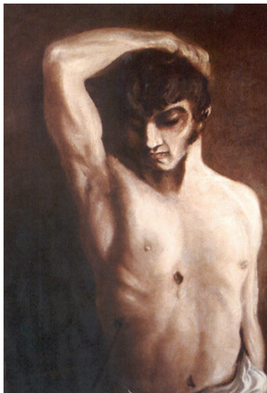
Fig. 4 - Doente com feridas provocadas pela entrada e saída de uma bala de espingarda. O projectil entrou ao nível da sétima costela direita sem atingir os órgãos vitais. The Paintings and Sketches of Sir Charles Bell (1809-1815) , Edinburgh, Royal College of Surgeons.