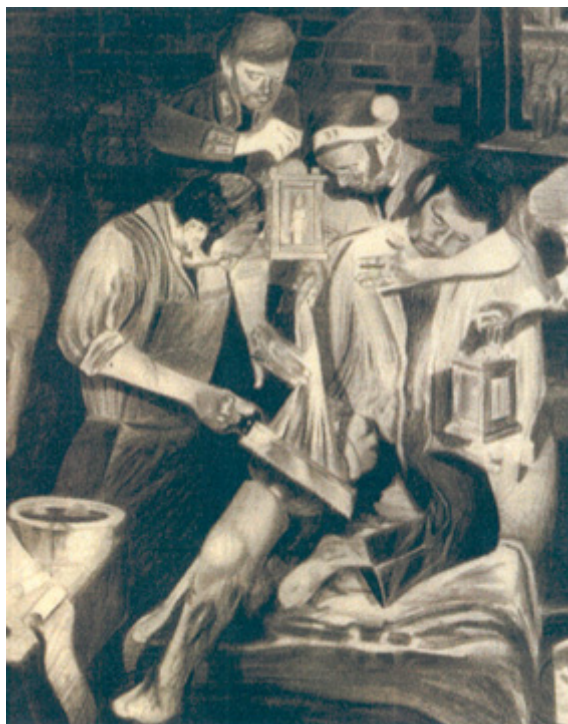
Fig. 7 - Cirurgia de amputação da coxa direita num hospital de campo.

Na maior parte das intervenções cirúrgicas de amputação dos membros, os pacientes acabavam por desmaiar e, quando isso acontecia, tanto melhor, porque o cirurgião trabalhava mais livremente e o lesionado não sentia a dor provocada pelos cortes dos tecidos. Os pacientes eram conhecedores de que, quando tinham de ser submetidos às cirurgias de amputação de um membro, teriam alguns minutos de grande sofrimento (fundamentalmente quando o cirurgião procedia à excisão dos tecidos vizinhos), seguido de várias semanas de desconforto, infelizmente na maior parte das vezes, complicadas pela sepsis , levando à morte ou, no caso de êxito, a uma longa e difícil convalescença. Os feridos sabiam que sujeitarem-se ao risco da cirurgia podia trazer-lhes vantagens: a salvação da vida.