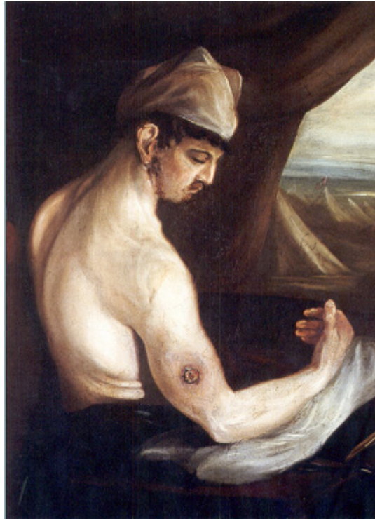
Fig. 3 - The Paintings and Sketches of Sir Charles Bell (1809-1815) , Edinburgh, Royal College of Surgeons.

tratamento, mas se o seu dedo o atravessasse, então recorria à amputação, (fig. 3).