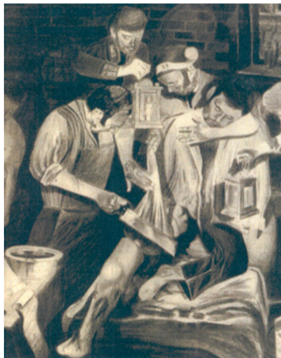
Fig. 7 - Cirurgia de amputação da coxa direita num hospital de campo.

Na maior parte das intervenções cirúrgicas de amputação dos membros, os pacientes acabavam por desmaiar e, quando isso acontecia, tanto melhor, porque o cirurgião trabalhava mais livremente e o lesionado não sentia a dor provocada pelos cortes dos tecidos. Os pacientes eram conhecedores de que, quando tinham de ser submetidos às cirurgias de amputação de um membro, teriam alguns minutos de grande sofrimento (fundamentalmente quando o cirurgião procedia à excisão dos tecidos vizinhos), seguido de várias semanas de desconforto, infelizmente na maior parte das vezes, complicadas pela sepsis , levando à morte ou, no caso de êxito, a uma longa e difícil convalescença. Os feridos sabiam que sujeitarem-se ao risco da cirurgia podia trazer-lhes vantagens: a salvação da vida.