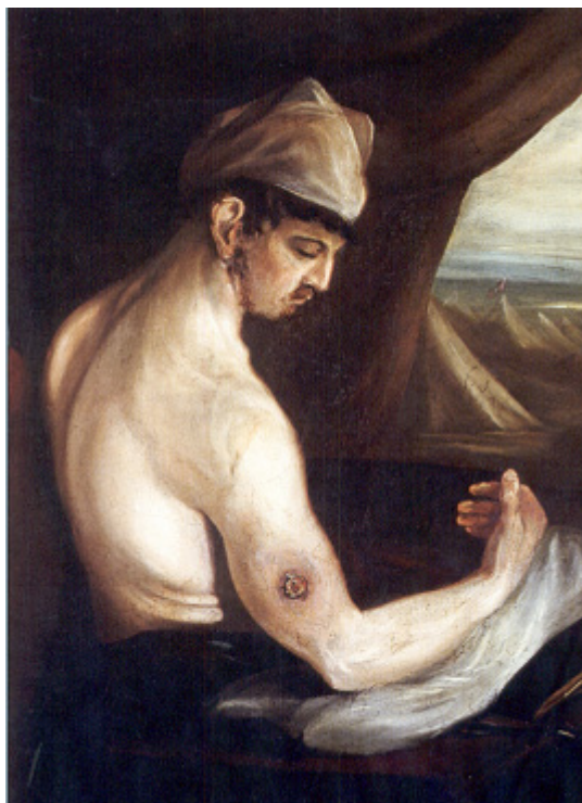
Fig. 3 - The Paintings and Sketches of Sir Charles Bell (1809-1815) , Edinburgh, Royal College of Surgeons.

tratamento, mas se o seu dedo o atravessasse, então recorria à amputação, (fig. 3).