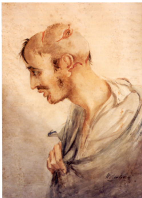
Fig. 1 - Soldado do 1st Royal Dragoons ferido no crânio por múltiplos golpes de sabre. The Paintings and Sketches of Sir Charles Bell (1809-1815) , Edinburgh, Royal College of Surgeons.

O número de soldados feridos com grandes cortes no couro cabeludo, escalpe fatiado, era bastante significativo, (fig. 1). Este género de ferimento era provocado pelo manuseamento dos sabres das unidades de Cavalaria quando desferiam os golpes montados nos cavalos e de cima para baixo com uma força bastante considerável aquando das cargas sobre a Infantaria. Estes eram comuns, mutilantes e por vezes mortais. Os múltiplos golpes podiam ser pequenos e superficiais, mas também grandes e profundos, fracturando o crânio chegando a atingir o cérebro.