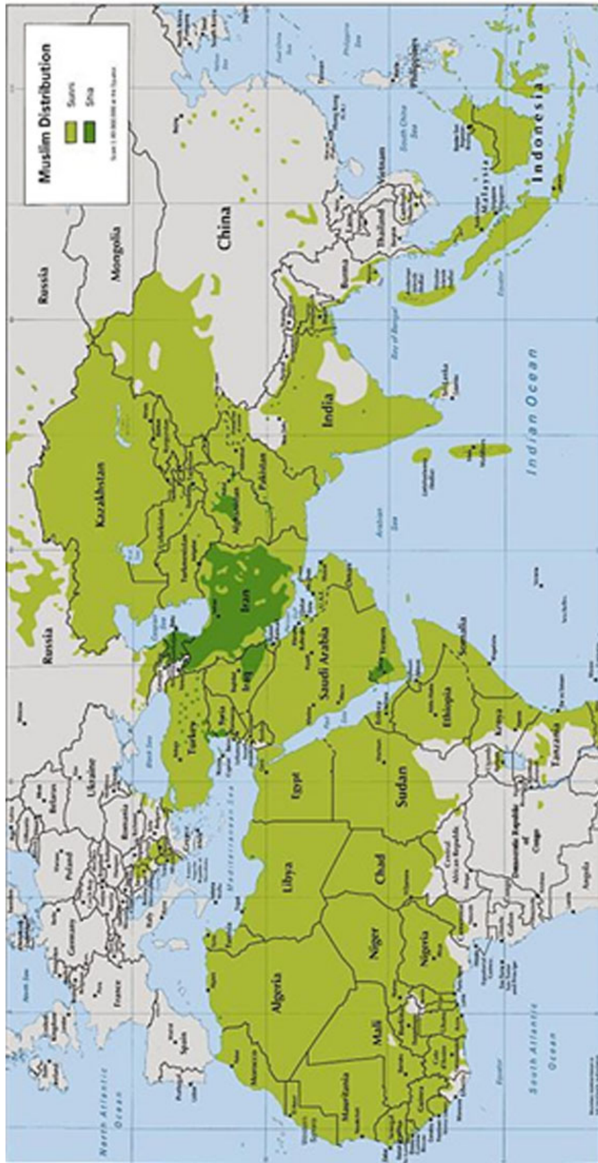
Fig. 4 – Distribuição dos muçulmanos