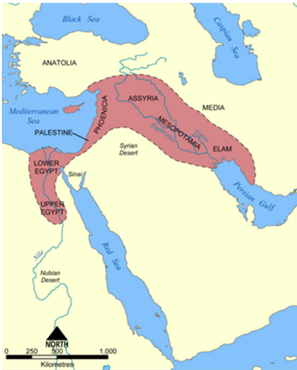
Fig. 2 - O “Crescente Fértil”