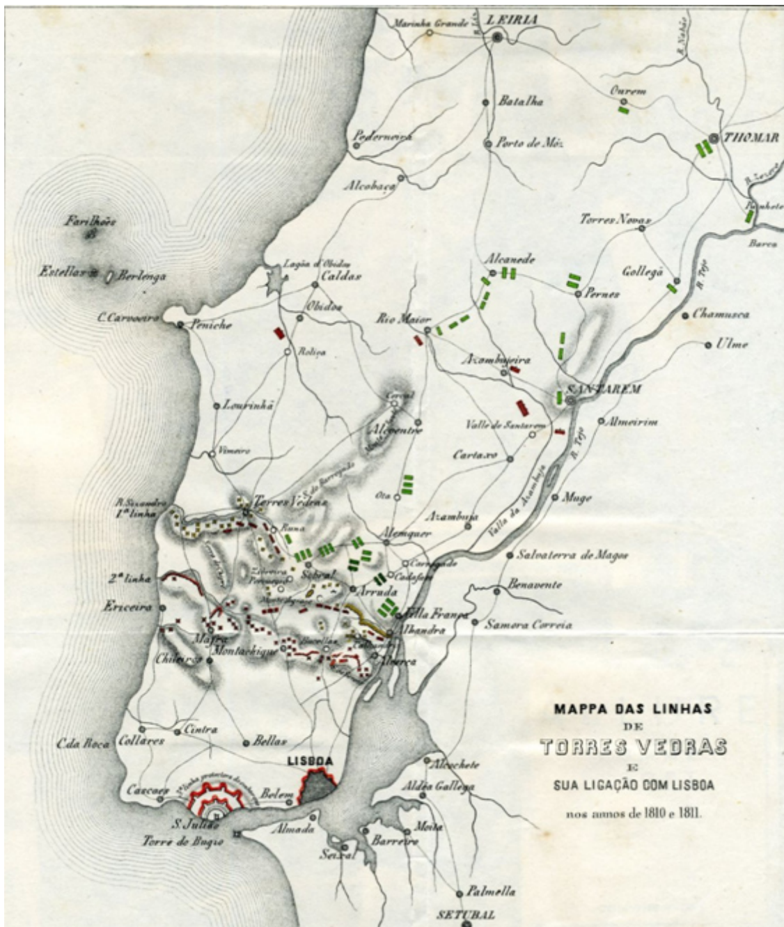
Fig. 2 - Mappa das Linhas de Torres Vedras e sua ligação com Lisboa..., Gravura anónima, Lisboa: Lithographia da Imprensa Nacional, [s. d.].