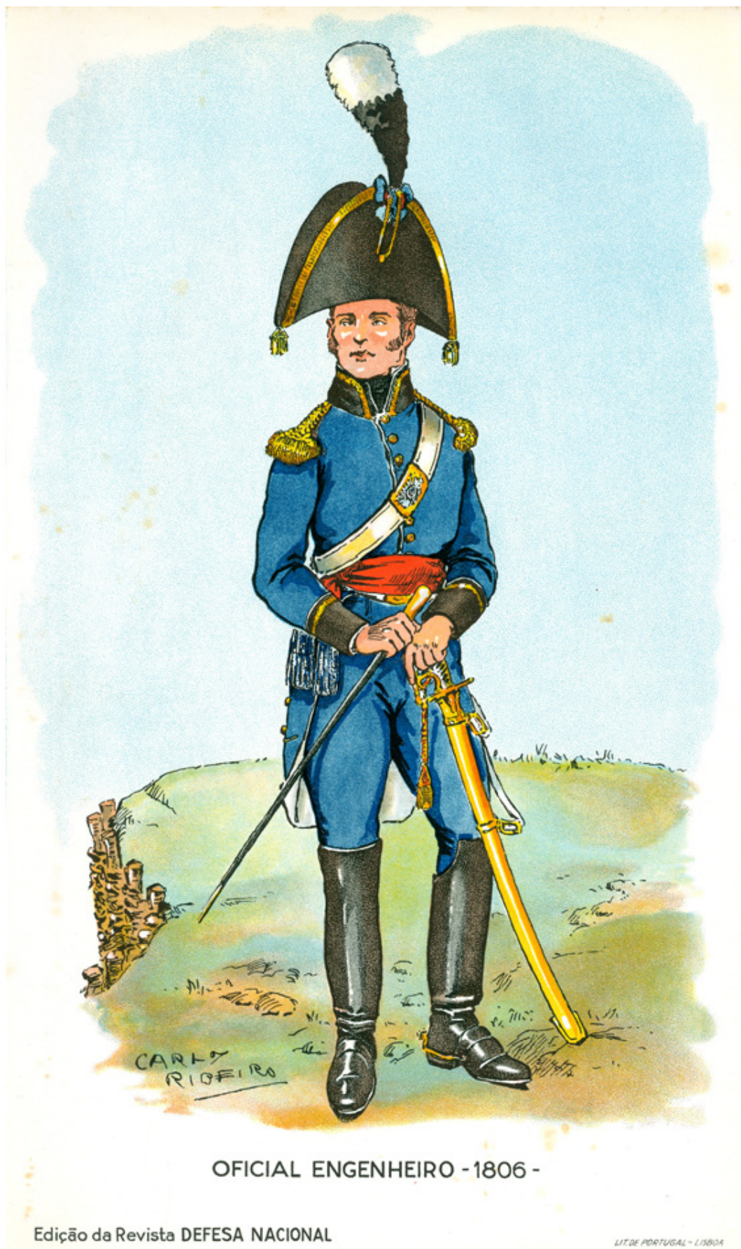
OFICIAL ENGENHEIRO - 1806 -