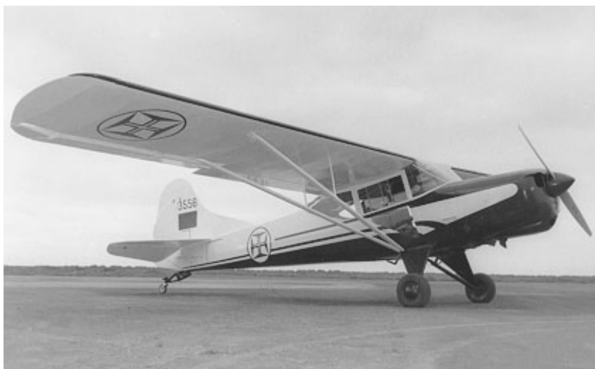
Foto 2. Um Auster no Negage

Xá-Muteba resultou na acalmia duma excitada multidão e salvou muitas vidas. Originalmente a missão era o lançamento do correio, fazendo uma primeira passagem baixa para alertar os habitantes e a segunda para lançar o embrulho no pequeno largo da povoação. Nas suas palavras: “Nesse dia não apareceu gente, mas vi uma extensa mancha de sangue rubra e fresca. Uma olhadela pelos arredores mostrou um grupo que fugia para o capim, qual bando de antílopes. Numa estrada estava um preso, de braços amarrados, entre dois cipaios. Era demais para a nossa curiosidade. No papel de embrulho escrevi: vamos aterrar. Perto havia uma longa faixa de terreno que nos pareceu ser o “campo de aviação” de que a administração falava. Em parte capinado e liso, parecia oferecer condições mais do que suficientes para aterragem e descolagem.