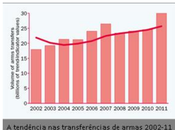
Fig. 2 - A tendência nas transferências de armas 2002-11