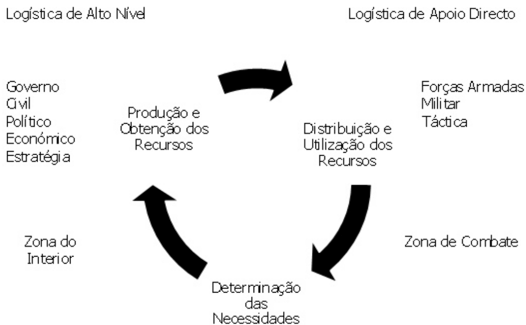
Figura 1 - O Ciclo Logístico