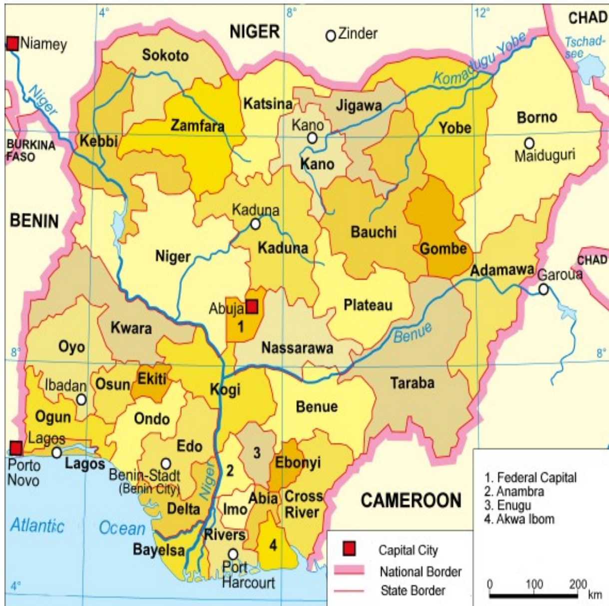
Mapa 2 - Nigéria: os 36 estados e a capital federal 68

Situada na já mencionada Zona de Compressão que se estende do Corno de África até à África Ocidental, mais concretamente no Golfo da Guiné, a Nigéria é o maior Estado africano em termos populacionais, com cerca de 170 milhões de pessoas que se dividem por mais de 250 grupos etnolinguísticos. É composto por trinta e seis estados federados que se dividem por seis zonas geopolíticas (Sudeste, Sul-Sul, Sudoeste, Nordeste, Noroeste e Norte Central), a que acresce a capital federal, Abuja, que, segundo Kalu N. Kalu, dada a parca força e efectividade política dos estados federados, é de onde emana a maior parte das políticas públicas, pelo que o federalismo nigeriano acaba por “reflectir